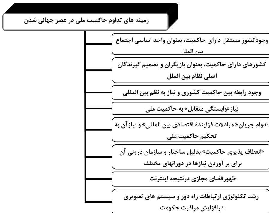
شکل (۲) زمینه های تداوم حاکمیت ملی در عصر جهانی شدن ( ترسیم از: نگارندگان)

همچنین، برخی مانند «تامسون» و «کراسنر» با زیر سوال بردن این ادعا که «وابستگی متقابل»، حاکمیت را تهدید می کند، استدلال می کنند که وابستگی متقابل به جای تهدید حاکمیت، خود نیازمند آن است. حکومتهایی دارای حاکمیت هستند که به تضمین و تثبیت حقوق مالکیت می پردازند و این خود، از شرایط لازم برای جریان بین المللی کالا و سرمایه است. مطابق با این استدلال، تحکیم حاکمیت خود از شرایط لازم برای جریان یافتن مبادلات فزاینده اقتصادی بین المللی است (Thomson and krasner, 1989: 197-198). «تامسون و کراسنر»، بر این اساس، هر گونه امکان بالقوه برای دگرگونی ساختاری عمده را که از پایین در رژیم حاکمیت رخ دهد، رد می کنند (Thomson and krasner, 1989: 216)، زیرا که وابستگی متقابل پیوسته نیازمند «تداوم» رژیم حاکمیت برای حفظ و پیگیری خود است. «کراسنر» در جای دیگر نیز همین استدلال اصلی را با تفصیلی بیشتر تکرار می کند. به نظر وی شواهد و سابقه تاریخی بسیار پیچیده تر از آن است که با تصور رایج درباره تهدید کنترل موثر حکومتی از جانب وابستگی متقابل مطابقت کند. بدین معنی که، کنترل موثر حکومتی به هر حال در