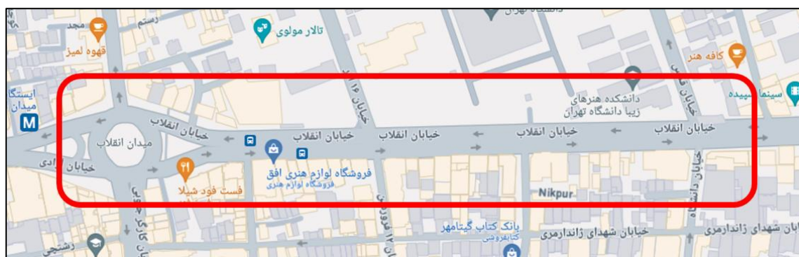
شکل (۱). محدوده مورد مطالعه در این پژوهش

خیابان انقلاب اسلامی یکی از خیابان‌های مهم و مرکزی شهر تهران است. (شکل ۱). این خیابان به علت واقع شدن دانشگاه تهران در کنار آن و نیز وجود فروشگاه‌های بزرگ کتاب و نشریات از خیابان‌های مهم تهران محسوب می‌گردد. محدوده مورد مطالعه این پژوهش، حدفاصل میدان انقلاب تا خیابان دانشگاه از این خیابان را شامل می‌شود که حال و هوای دانشگاهی و فرهنگی بر آن غالب است. لازم به ذکر است محدوده مورد مطالعه مشتمل بر بخش سواره‌رو و پیاده‌رو خیابان می‌باشد. طی پایش میدانی و مصاحبه با کاربران این محدوده مشخص گردید، بیشتر افراد از دانشجویان گرفته تا خریداران کتاب و مغازه‌داران و یا حتی رهگذران، بر عدم امنیت نسبی این خیابان اذعان دارند. ۶۲ درصد از افرادی که در مصاحبه مشارکت کردند، به وجود جرمی نظیر کیف‌چاپی، دزدی و مزاحمت خیابانی اشاره داشتند. شکل ۱ محدوده مورد مطالعه در پژوهش پیش رو را نشان می‌دهد. جداره شمالی این بخش از خیابان انقلاب در منطقه ۶ از مناطق ۲۲ گانه تهران و ضلع جنوبی آن جزء منطقه ۱۱ می‌باشد. وجود دانشگاه تهران به عنوان یک کاربری در مقیاس ملی و کتاب‌فروشی‌ها و انتشاراتی‌های مقابل آن سبب جذب جمعیت از سراسر ایران به این نقطه گشته و بر اهمیت این مکان می‌افزاید.