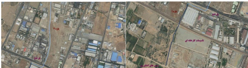
شکل (۴). تصویر هوایی مسیر بازه ۱