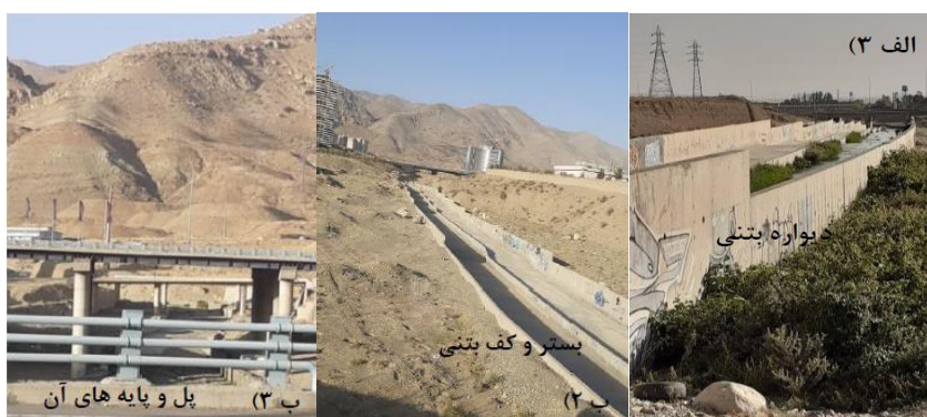
شکل (۹). ادامه: الف ۳) تصویر میدانی مسیر بازه ۶. ب ۲) و ب ۳) تصاویر میدانی مسیر بازه ۷.

بازه ۸ از ابتدای شهرک بالادست اتوبان شهید خرازی شروع شده و تا بعد از مناطق مسکونی امتداد دارد. از نظر شاخص عملکردی در این بازه پیوستگی طولی با تغییرات کم وجود دارد که جلوی عبور سیلاب را نمی‌گیرد و اشکال بستری سازگار با شیب دره هستند و دیواره‌های در اطراف رودخانه وجود ندارد و رسوبات ریزدانه فراوان در بخش‌های مختلفی از بازه وجود دارد و از نظر شاخص مصنوعی دارای تغییرات جریان و تغییرات دبی مشخصی می‌باشد و تغییرات مصنوعی در کمتر از ۱۰