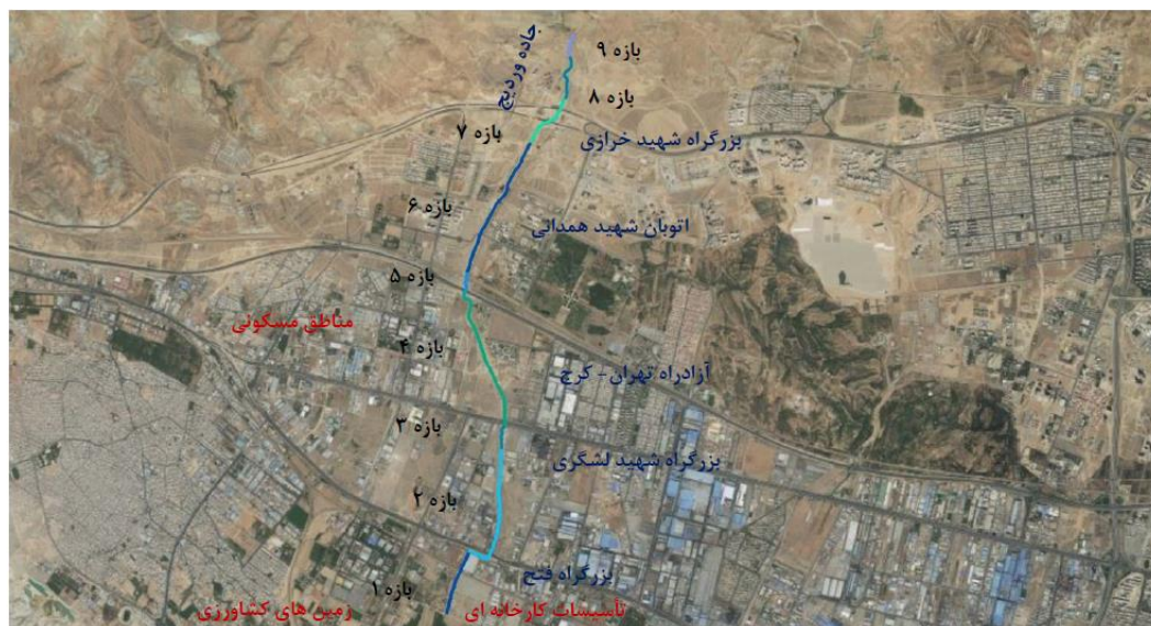
شکل (۲). موقعیت بازه‌های رودخانه و تقاطع با اتوبان‌ها و کاربری اراضی حاشیه آن