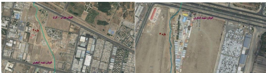
شکل (۶). تصویر هوایی مسیر بازه ۳

بازه ۴ از بالادست اتوبان شهید لشگری شروع شده و تا اتوبان تهران - کرج امتداد دارد. از نظر شاخص عملکردی در این بازه تغییرات قابل ملاحظه‌ای در پیوستگی طولی وجود دارد که از حرکت رسوب و چوب جلوگیری می‌کند و به دلیل وجود بستر مصنوعی دگرگونی کامل اشکال بستر و همچنین تغییرات رسوبات گسترده به صورت رخنمون‌های سنگی مشاهده می‌شود و دارای کانال به صورت دیواره بتنی می‌باشد و از نظر شاخص مصنوعی تغییرات جریان و تغییرات دبی قابل ملاحظه می‌باشد و همچنین تغییرات مصنوعی در مسیر رودخانه وجود دارد و از نظر شاخص تعدیل کانال در بازه مورد ارزیابی تغییر الگوی کانال مشابه و تغییرات متوسط در عرض کانال و تغییرات محدود در سطح اساس بستر وجود دارد. بازه ۴ از نظر کیفیت مورفولوژیکی (MQI) دارای امتیاز ۰/۲ و کیفیت خیلی ضعیف می‌باشد شکل (۷).