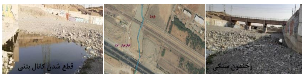
شکل (۸). تصاویر هوایی و میدانی مسیر بازه ۵

بازه ۶ از بالای خط متروی تهران- کرج شروع شده و تا بعد از اتوبان شهید همدانی امتداد دارد و بازه ۷ نیز از نرسیده به اتوبان شهید خرازی شروع شده و تا بعد از آن امتداد دارد. از نظر شاخص عملکردی در بازه‌های ۶ و ۷ پیوستگی طولی با تغییرات کم وجود دارد که جلوی عبور سیلاب را نمی‌گیرد و به دلیل وجود بستر مصنوعی دگرگونی کامل اشکال بستر و همچنین تغییرات رسوبات گسترده به صورت رخنمون‌های سنگی مشاهده می‌شود و همچنین دارای کانال به صورت دیواره بتنی می‌باشد و از نظر شاخص مصنوعی تغییرات جریان و تغییرات دبی قابل ملاحظه می‌باشد و همچنین تغییرات مصنوعی در مسیر رودخانه وجود دارد و از نظر شاخص تعدیل کانال در بازه‌های مورد ارزیابی تغییر الگوی کانال مشابه و تغییرات متوسط در عرض کانال و تغییرات محدود در سطح اساس بستر وجود دارد. بازه ۶ و ۷ از نظر کیفیت مورفولوژیکی (MQI) دارای امتیاز ۰/۲ و کیفیت خیلی ضعیف می‌باشد. در بازه ۷ با توجه به خطرات ناشی از وقوع سیلاب به دلیل تغییرات حریم و بستر و استقرار پل‌های بزرگراه شهید خرازی در حریم و بستر رودخانه، تأمین ایمنی پایه‌های پل به همراه ایجاد فضاهای سبز حائل بین رودخانه و شبکه بزرگراهی مهم‌ترین رویکردی است که در بازه شماره ۷ می‌توان لحاظ نمود شکل (۹).