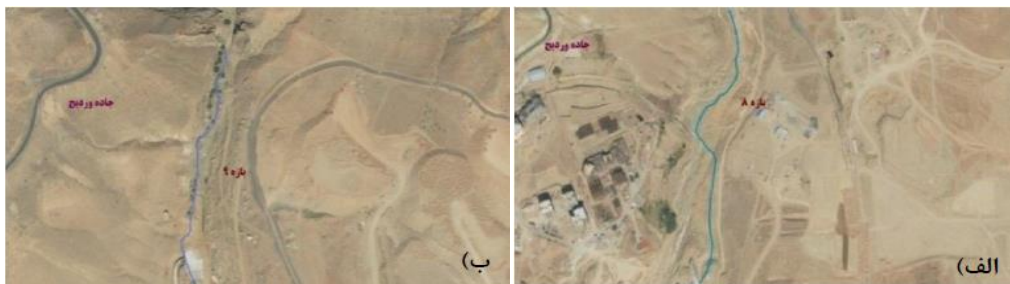
شکل (۱۰). الف) تصویر هوایی مسیر بازه ۸. ب) تصویر هوایی مسیر بازه ۹.

بازه ۹ از کنار جاده وردیج شروع شده و تا ابتدای رشته کوه البرز امتداد دارد. از نظر شاخص عملکردی در این بازه تغییرات قابل ملاحظه‌ای در پیوستگی طولی وجود دارد که از عبور سیلاب جلوگیری می‌کند و اشکال بستری سازگار با شیب دره هستند و دیواره‌ای در اطراف رودخانه وجود ندارد و رسوبات ریزدانه فراوان در بخش‌های مختلفی از بازه وجود دارد و از نظر شاخص مصنوعی دارای تغییرات جریان و تغییرات دبی مشخصی می‌باشد و تغییرات مصنوعی در کمتر از ۱۰ درصد طول بازه وجود دارد و از نظر شاخص تعدیل کانال در بازه مورد ارزیابی عدم وجود تغییرات در الگوی کانال، تغییرات محدود در عرض کانال و تغییرات ناچیز در سطح اساس بستر وجود دارد. بازه ۹ از نظر کیفیت مورفولوژیکی (MQI) دارای امتیاز ۰/۶ و کیفیت متوسط می‌باشد. امکانات موجود در این بازه شامل: وجود توپوگرافی مناسب جهت احداث سد تأخیری و کاهش ریسک سیلاب، عدم وجود ساخت‌وسازهای غیرمجاز و کاربری‌های ناسازگار، امکان تأمین آب پایه و تغذیه آبخوان، عبور جاده وردیج به‌عنوان یک معبر شریانی از ضلع غربی بازه می‌باشد. با توجه به امکانات موجود در خصوص بازه شماره ۹ انتظار می‌رود که رودخانه و همچنین اراضی بکر و چشم‌اندازهای طبیعی موجود تا حد امکان حفاظت شوند و جهت جلوگیری از تخریب این ویژگی‌های ارزنده، باید با ایجاد پهنه حفاظتی با غلبه فعالیت‌های تفرجگاهی نسبت به بهره‌گیری از امکانات موجود بهره جست. در این حین توجه به ایمنی و امنیت رودخانه در این بازه به‌عنوان بازه بالادست رودخانه از اهمیت فراوانی برخوردار است اشکال (۱۰ ب، ۱۱ ب).