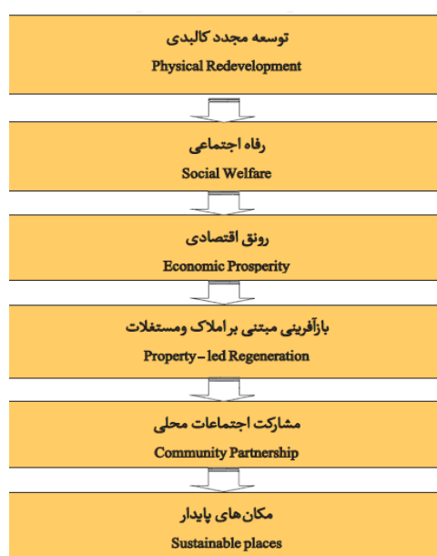
شکل (۱). تعامل بازآفرینی و توسعه پایدار

توسعه پایدار دارد. نقطه برخورد و تلاقی این دو مفهوم با یکدیگر بر منطقی دیدن توسعه و نیل به برآیند مثبت اثرات مختلف عوامل اجتماعی- فرهنگی، محیطی و اقتصادی هست (پوراحمد و همکاران، ۱۳۹۶، ۱۷۶). بدین ترتیب به تدریج نظریه شهرهای پایدار با دیدگاه بازآفرینی مرتبط گردیده است. در این راستا تعاریفی از بازآفرینی شکل گرفت که به مؤلفه‌های پایداری نزدیک شده است. اساس بازآفرینی شهری پایدار، تعاملات اجتماعات محله‌ای و دستیابی به توافق عمومی است. بدین معنی که در بازآفرینی شهری گونه‌های جدید نهادی شکل می‌گیرند که سعی دارند سیاست‌های بازآفرینی اجتماع مدار را به صورت جامع و یکپارچه و از پایین به بالا تبیین کنند به صورتی که همه افراد ذی‌نفع را در بر بگیرد (فرجی ملائی، ۱۳۸۹، ۱۵). با وجود ظهور مفاهیم نو در بازآفرینی و توسعه پایدار، هماهنگی کمی بین این دو؛ خصوصاً بازآفرینی اقتصادی در مقایسه با پایداری برای نیل به اهداف بازآفرینی شهری وجود داشته است. تعامل مابین دو مفهوم بازآفرینی و توسعه پایدار در شکل (۱) به تصویر کشیده شده است.