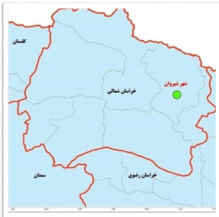
شکل (۱). موقعیت محدوده مورد مطالعه