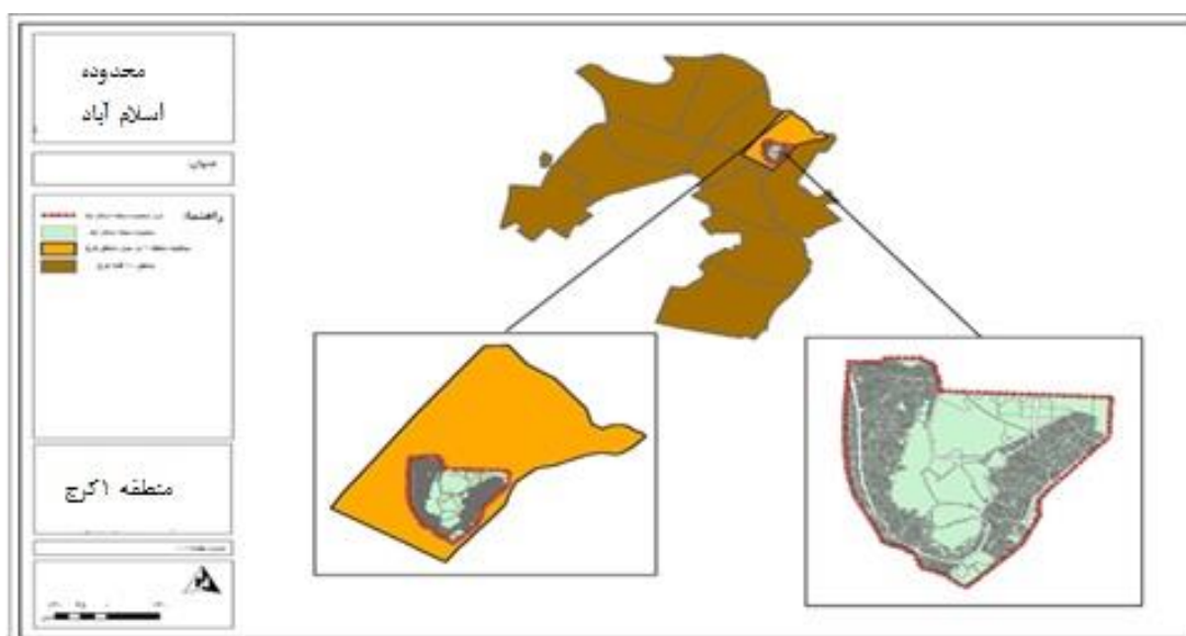
شکل (۲). موقعیت محدوده مورد مطالعه (محله اسلام‌آباد کرج)

از نظر مختصات جغرافیایی، محله اسلام‌آباد در طول جغرافیایی ۵۱ درجه، ۰۰ دقیقه و ۰۸ ثانیه شرقی و در عرض ۳۵ درجه، ۰۸ دقیقه و ۲۲ ثانیه شمالی قرار گرفته است و ارتفاع آن از سطح دریا، ۱۴۸۰ متر می‌باشد. این محله در قسمت شمال شرقی شهر کرج واقع شده است موقعیت نسبی محله: محله اسلام‌آباد (مراد آب) در منطقه یک شهرداری کرج واقع شده است این محله دارای ۱۷۱ هکتار مساحت بوده و تعداد پلاک‌های واقع شده در آن حدود ۹ هزار پلاک و تعداد معابر موجود نیز برابر با ۸۵۸ معبر می‌باشد. همچنین محله اسلام‌آباد براساس آخرین سرشماری رسمی کشور حدود ۳۳۸۰۰ هزار نفر جمعیت دارد؛ که تعداد خانوار ۱۱۳۶۰ خانوار و بعد خانوار آن ۳.۳۸ بوده که این رقم در منطقه یک دارای ۳۸۶۰۰ خانوار و بعد خانوار نیز ۳.۳۴ در شهر کرج نیز ۵۰۸۴۰۰ خانوار و بعد خانوار ۳.۱۳ استان البرز نیز دارای ۸۵۶۱۱۶ خانوار و بعد خانوار ۳.۱۷ می‌باشد بر اساس مرکز آمار بعد خانوار در کشور ۳.۳ است.