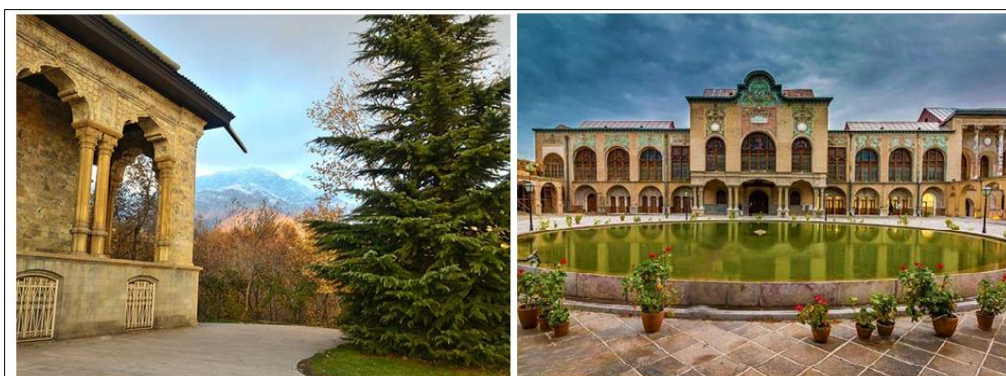
شکل (۲). جاذبه‌های شهر تهران (سمت راست: تصویر باغ موزه نگارستان؛ سمت چپ: تصویر کاخ سعدآباد)