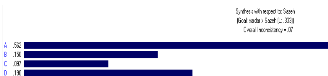
شکل (۳). اولویت‌بندی ویژگی‌های کالبدی سردر بناها (زیرمعیارها) دوره پهلوی در شهر زاهدان

اولویت‌بندی ویژگی‌های تزئینی سردر بناهای دوره پهلوی در شهر زاهدان (زیرمعیارها) اولویت‌بندی ویژگی‌های تزئینی سردر بناهای دوره پهلوی در شهر زاهدان نیز بررسی شد. در این زمینه نیز چهار ویژگی مورد تأکید بوده است که شامل کتیبه آجری ساده، تزئینات (ساده، جناغی، پیچ ماری و رگ چین)، تاجدار ساده با طاق گرد و جناغی و آجرکاری ساده با چین افقی است. تحلیل دیدگاه کارشناسان نشان می‌دهد که ویژگی استفاده از تزئینات ساده، جناغی، پیچ ماری و رگ چین با وزن ۰/۳۷۶ به‌عنوان مهم‌ترین ویژگی یا شاخص تزئینی سردر بناها شناخته شده است. در حقیقت این ویژگی، سردر بناهای دوره پهلوی در شهر زاهدان را متمایز می‌نماید. همچنین استفاده از کتیبه‌های آجری ساده نیز با وزن ۰/۲۴۱ در رتبه دوم اهمیت قرار گرفته است که در بیشتر بناها و سردر بناها قابل‌مشاهده است و نقش مهمی را در تزئینات سردرها ایفا می‌کند. تاجدار بودن ساده با طاق گرد و جناغی با وزن ۰/۲۳۱ در رتبه سوم و آجرکاری ساده با چین افقی نیز با وزن ۰/۱۵۲ در رتبه چهارم این اولویت‌بندی و اهمیت قرار گرفته‌اند؛ بنابراین استفاده از آجر، تاجدار بودن، استفاده از طاق‌های گر و جناغی و همچنین تزئینات غالب با آجر و به‌صورت ساده، غالب ویژگی‌های تزئینی سردر بناهای دوره پهلوی در شهر زاهدان محسوب می‌شود. جدول (۶) و شکل (۴) اولویت‌بندی ویژگی‌های تزئینی سردر بناها (زیرمعیار) دوره پهلوی در شهر زاهدان را با روش AHP نشان می‌دهد.