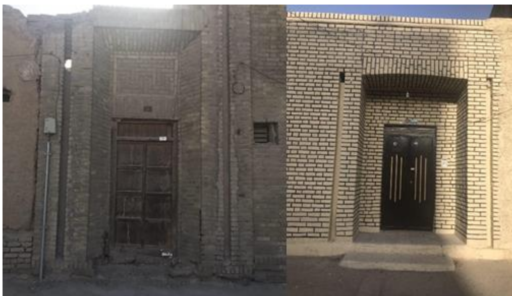
شکل (۲). سردر و تزیینات بنای مسکونی دوره پهلوی در شهر زاهدان (محقق، ۱۴۰۰)

بازشناسی سردر بناهای دوره پهلوی در شهر زاهدان بر اساس تزیینات نما جمع‌بندی بررسی سردر بناهای دوره پهلوی در شهر زاهدان بر اساس فراوانی تعداد بناها نشان می‌دهد که از ۸ بنای بررسی شده، همه آن‌ها جز بناهای با سبک معماری سنتی است؛ چراکه شکل، نقوش و مصالح به‌کاررفته در آن‌ها به‌خوبی این مطلب را تأیید می‌نمایند. مصالح غالب آجر، گچ، آهک و رس بوده که در تمامی سردرها قابل مشاهده است. نوع کتیبه به‌کاررفته در سردرها نیز آجرکاری ساده بوده است. تزیینات نیز به‌صورت ساده و جناغی و در برخی موارد تزیینات رگ چین و پیچ ماری نیز دیده می‌شود. نقوش خاصی نیز دیده نمی‌شود و بیشتر نقوش ساده و با استفاده از آجر انجام گرفته است. وجود تاج و طاق نیز از دیگر خصوصیات تزیینی سردر بناهای دوره پهلوی در شهر زاهدان است؛ بنابراین بررسی سردر بناها بر اساس تزیینات نما نشان می‌دهد که تزیینات مبتنی بر سبک معماری سنتی بوده و بیشتر نقوش، اشکال و کتیبه‌های به‌کاررفته در سردر بناها شامل آجرکاری، استفاده از طرح‌ها و اشکال ساده بوده و نقوش باستانی و غربی به‌کار نرفته است. در حقیقت آجر و استفاده از مواد سازگار با اقلیم منطقه با طراحی‌های ساده و در بسیاری از موارد بدون طرح در سردرها، گونه غالب محسوب می‌شود؛ بنابراین گونه غالب سردر بناهای شهر زاهدان، از نوع معماری سنتی و به‌صورت ساده و تزیینات نیز مبتنی بر آجر بوده است (جدول (۳)).