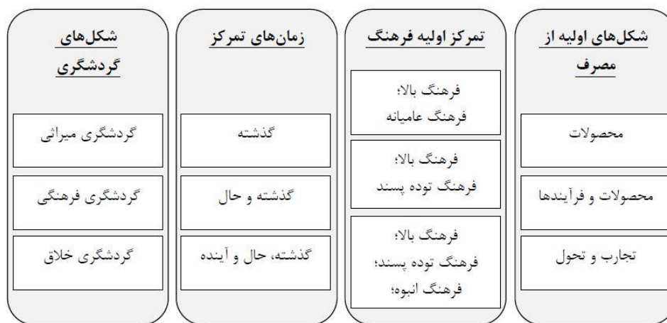
شکل (۲). ویژگی‌های گردشگری فرهنگی در کنار میراث فرهنگی و گردشگری خلاق

با این حال بیشتر موارد ذکر شده مبتنی بر محصول است (OECD, 2009). به همین دلیل به هیچ طریقی نمی‌توان جلوی کالایی شدن فرهنگ را گرفت چرا که در اهمیت نقش محصولات فرهنگی در توسعه گردشگری جهت کسب سود بالاتر در مناطق مختلف هیچ شکی وجود ندارد. تجارب فرهنگی می‌تواند منجر به افزایش محصولات فرهنگی و همچنین جذب گردشگران جدید به منطقه شود که در این صورت جذب بازدیدکنندگان بر اساس عوامل انگیزشی مبتنی بر فرهنگ صورت می‌گیرد. گزارش سازمان همکاری اقتصادی و توسعه سازمانی در سال ۲۰۰۹ که نشان‌دهنده تأثیر فرهنگ بر روی گردشگری است، بیان می‌کند که گردشگری فرهنگی می‌تواند نقش عمده‌ای در توسعه مناطق مختلف، گرد هم آوردن مردم با سنت‌های متعدد و به اشتراک‌گذاری آداب و رسوم و ارزش‌ها داشته باشد. یکی از مهم‌ترین مشکلات در این زمینه از نظر راج این است که: اصطلاح «فرهنگ» به شدت در طول دو دهه گذشته مورد بحث قرار گرفته و هیچ تعریف روشن و مورد قبولی از مفهوم آن توسط جامعه به عنوان یک کل نشده است. این مورد ارتباط نزدیکی با هویت ملی ما دارد که مردم را در سازمان‌های اجتماعی، محلی و ملی مانند دولت‌های محلی، نهادهای آموزش و پرورش، جوامع مذهبی، کار و فراغت و تفریح قرار می‌دهد (Raj, 2012)؛ در نتیجه در چنین شرایطی چگونه فرهنگ می‌تواند یک ابزار و اهرمی در توسعه گردشگری محسوب شود. پس اولین گام در توسعه گردشگری فرهنگی در یک جامعه، تعریف روشنی از فرهنگ آن جامعه و محصولات فرهنگی آن است. رایج‌ترین روش صورت گرفته در برخورد با گردشگری فرهنگی کاهش ناملموس یک محصول در بازار و ایجاد تمایز بین محصولات و تبدیل آنها به محصولات مختلف و مرتبط با مفاهیم گردشگری میراث فرهنگی، گردشگری فرهنگی و گردشگری خلاق است. شکل (۲).