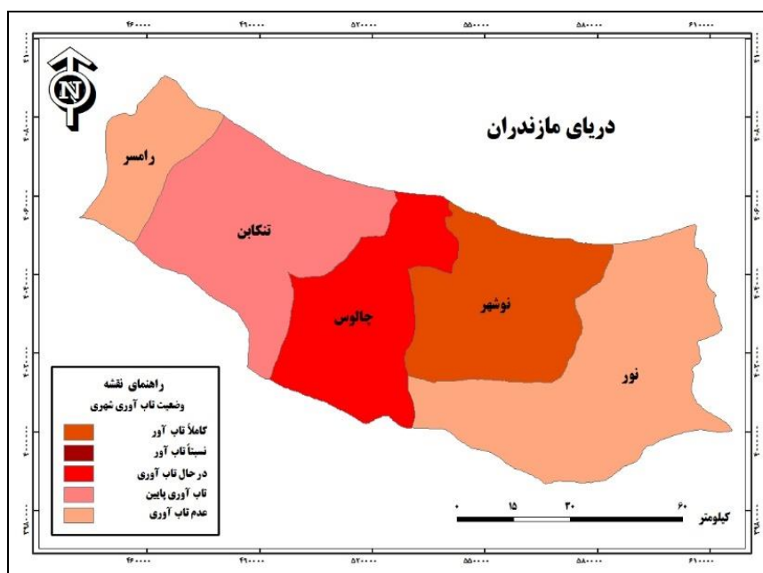
شکل (۲). نقشه شهرهای ساحلی غرب استان مازندران بر اساس وضعیت تاب آوری شهری

مقایسه شهرهای ساحلی غرب استان مازندران بر اساس وضعیت تاب آوری کالبدی-زیرساختی با استفاده از تکنیک ایداس