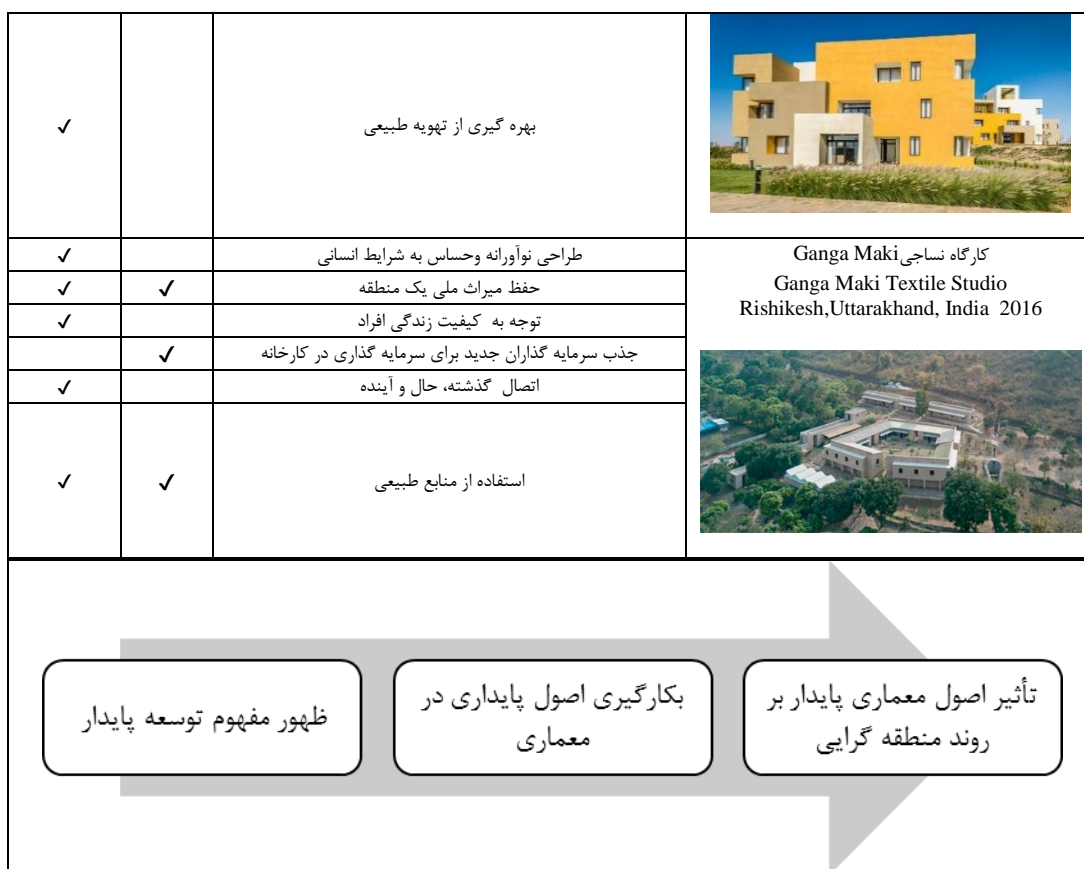
شکل (۳). فرایند تحول منطقه گرای پایدار

الکساندر زونیس و لیان لفور در آخرین چشم انداز خود در باب منطقه گرای، نمونه هایی از پروژه های اجرایی متفاوت در کشورهای مختلف دنیا را ذکر کرده و خاطر نشان می سازند که طی سال های واپسین قرن بیستم تا به امروز، تئوری معماری منطقه ای از منظرهای مختلف گرایش های زیادی گرفته و بسط یافته و با عملکرد خود نیز متناسب تر شده است. از تحلیل این آثار می توان به این نتیجه دست یافت که برخی از آثار منطقه گرای امروز از رویکرد پایداری تأثیر پذیرفته و دارای ویژگی های پایداری هستند. همچنین با بررسی سایر آثار که در مجلات و جوایز معماری که در سالهای اخیر از آنها با عنوان معماری منطقه گرا یاد شده می توان تاییدی بر نظریه زونیس و لفور در مورد ویژگی های منطقه گرای امروز باشد.