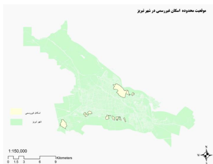
شکل (۱). موقعیت سکونتگاه‌های غیررسمی در شهر تبریز.

رواسان و آخماقیه حاشیه‌نشین محسوب می‌شوند. به لحاظ شرایط توپوگرافی، این محلات در شیب‌های بسیار تند واقع شده‌اند و بسیاری از آن‌ها دسترسی سواره ندارند و رفت‌وآمد از طریق پلکان انجام می‌گیرد. نداشتن سیستم فاضلاب و تأسیسات استاندارد از دیگر ویژگی‌های این محلات است. کیفیت مسکن این محلات بسیار پایین و حتی گاه با مصالحی چون خشت و گل می‌باشد. بافت متراکم و غالب مسکونی که بدون هیچ‌گونه فضای باز و سبز می‌باشد در این مناطق به چشم می‌خورد (شکل ۲).