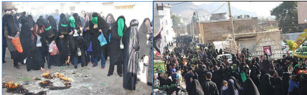
شکل (۱): افراد حاضر در مراسم چهل منبر شهرستان خرم‌آباد روز تاسوعای سال ۱۳۹۷