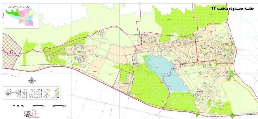
شکل (۱). موقعیت منطقه ۲۲ و نظام کاربری آن