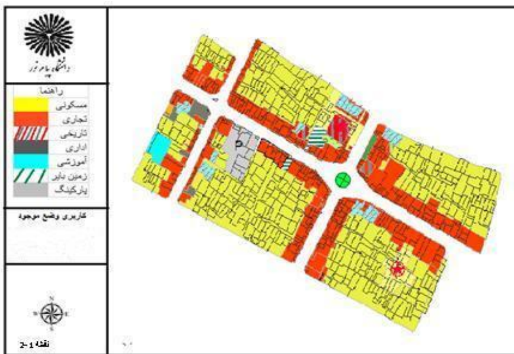
شکل (۱) بررسی کاربری‌های محدوده مورد مطالعه

ابتدا با استفاده از روش اسنادی و ابزاری همچون کتاب‌ها، مقالات، مجلات و ... به گردآوری اطلاعات مربوط به محدوده مورد مطالعه پرداخته و سپس با استفاده از روش غیر اسنادی (میدانی)، بازدید میدانی و تهیه عکس به تجزیه و تحلیل وضع موجود و ارائه راهکارهای مناسب پرداخته شد. سپس شاخص‌های کیفیت محیطی بررسی و تحلیل شده است، تا با تأکید بر ابعاد فرهنگی اجتماعی، به تأثیر پیاده راه بر تعاملات اجتماعی با استفاده از برداشت‌های میدانی و مصاحبه با ساکنان به جمع‌آوری داده‌ها پرداخته شده است.