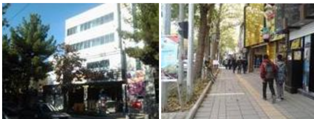
شکل (۳). تقسیم بنا به احجام متناسب با دانه بندی بخش تاریخی شهر

طرح و اجرای بناهای واقع در مناطق تاریخی شهر باید دارای مقیاس انسانی بوده و دانه بندی و ریخت شناسی مشابه بافت تاریخی شهر داشته باشد. در طراحی معماری بناهای کلان مقیاس، تقسیم بنا به احجام متناسب با دانه بندی بخش تاریخی شهر الزامی است.