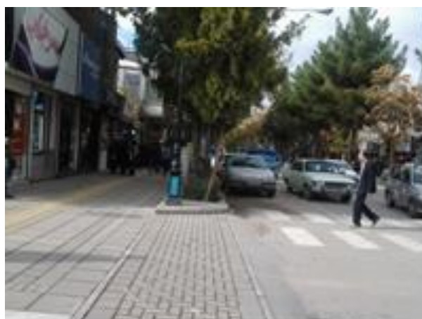
شکل (۶) اختلاف سطح (لبه، پله، سکو و ...) در مسیر عبور در معابر پیاده

ایجاد هرگونه اختلاف سطح (لبه، پله، سکو و ...) در مسیر عبور در معابر پیاده ممنوع است و تغییرات سطوح بایستی بوسیله شیب راهه و رمپ انجام شود. شکل (۶).