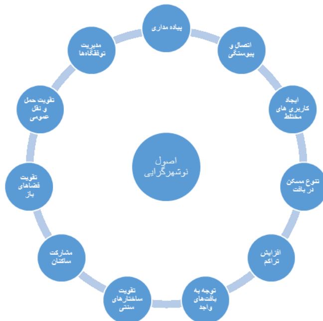
شکل (۱). اصول نوسازگرایی. منبع (CNU & HUD, 2000)