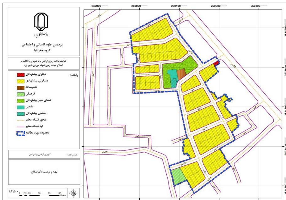
شکل (۳). کاربری اراضی پیشنهادی

در محدوده مورد مطالعه، ۹۲ قطعه زمین وجود دارد که در ابتدا برای انجام محاسبات، باید شماره‌گذاری شوند. شکل (۳) کاربری اراضی پیشنهادی را نشان می‌دهد.