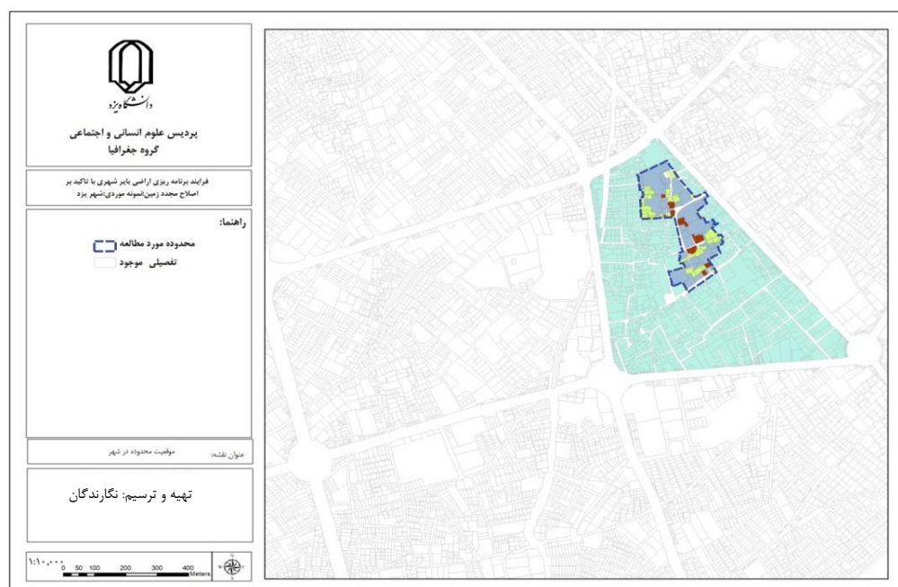
شکل (۱). موقعیت محدوده مورد مطالعه در شهر یزد

تحقیق حاضر از نظر هدف، یک تحقیق توسعه‌ای- کاربردی می‌باشد. از نظر گردآوری داده‌ها و اطلاعات و روش تجزیه و تحلیل یک تحقیق توصیفی- تحلیلی بوده که در بین انواع تحقیقات توصیفی، از نوع مطالعه موردی می‌باشد. اطلاعات مورد نیاز به طور عمده از منابع کتابخانه‌ای، نتایج سرشماری‌ها و طرح‌های توسعه شهری تهیه شده توسط مهندسين مشاور و قسمتی از طریق پیمایش گردآوری گردیده است. در ادامه، محدوده‌ای از شهر یزد که به نظر می‌رسد قابلیت استفاده از روش اصلاح مجدد در آن وجود دارد انتخاب و سپس محاسبات مربوط به این روش با استفاده از نرم‌افزارهای GIS و EXCEL انجام و طرح پیشنهادی برای محدوده ارائه گردیده است. در فرآیند اصلاح مجدد، ابتدا بایستی نرخ قابلیت محدوده محاسبه شود. اگر نرخ قابلیت مجموعه بزرگتر از عدد ۲ برآورد گردد، مطالعه میزان توجیه‌پذیری محدوده برای اصلاح مجدد زمین باید انجام گیرد. در مرحله بعد نرخ توجیه‌پذیری محدوده ( \alpha ) محاسبه می‌گردد. چنانچه \alpha < 1 باشد، این دسته از پروژه‌ها، ممکن است نیازمند کمک‌های مالی باشند. اگر 1/5 < \alpha < 1 باشد، بدان معناست که احتمال ناکامی طرح و وقوع نتایج مغایری با تراز مالی تدوین شده وجود دارد. در صورت \alpha > 1/5 ، بدان معناست که محدوده طرح، مناسب توسعه است. در ادامه بقیه شاخص‌های مورد نیاز محاسبه می‌گردند. جدول (۱) تمامی شاخص‌ها و نحوه محاسبه آنها را نشان می‌دهد.