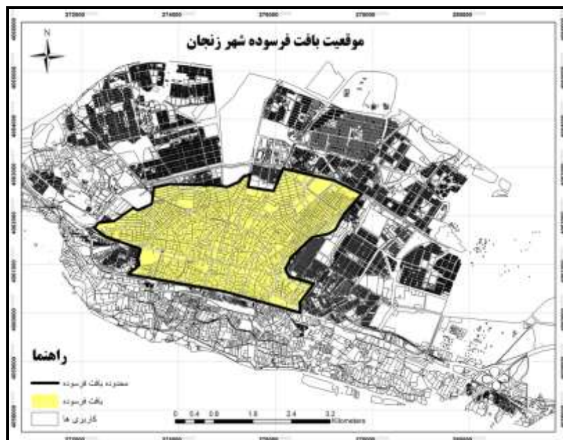
شکل (۱). موقعیت بافت فرسوده شهر زنجان (ترسیم نگارندگان، ۱۳۹۵)

قطعات ۸- شبکه‌های محلی غیررسمی موجود در محلات مانند صندوق‌های قرض الحسنه، خیریه‌ها و هیات‌های مذهبی که گاه‌آوازه جهانی دارند (مثل حسینیه اعظم زنجان) ۹- وجود مساجد مختلف و کارگاه‌های صنایع دستی که از قدیم‌الایام باعث پویایی ارتباطات و خیرخواهی در مقابل منفعت‌طلبی شخصی شده است. ۱۰- تأسیسات زیربنایی نامناسب ۱۱- مشکلات زیست محیطی و بالابودن حجم آلودگی ۱۲- کمبود امکانات گذران اوقات فراغت ۱۳- فقر و محرومیت ۱۴- آسیب‌پذیری در برابر زلزله ۱۵- سرانه کم خدمات ۱۶- تراکم جمعیت بالا ۱۷- ناامنی و معضلات اجتماعی. همچنین طبق شاخص‌هایی که توسط شورای عالی شهرسازی و معماری صورت گرفته، ویژگی‌های بافت فرسوده سه مولفه (ناپایداری، نفوذناپذیری و ریزدانگی) هستند و هر سه مورد در بافت فرسوده شهر زنجان دیده می‌شود.