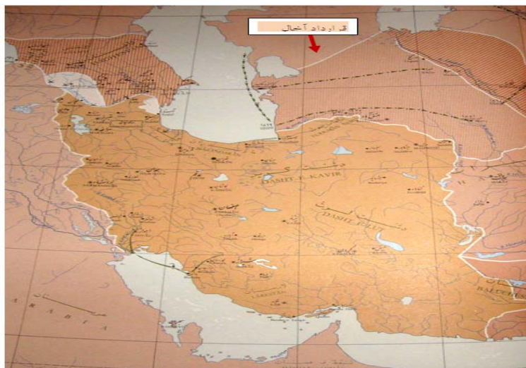
شکل (۱) نقشه سرزمین‌های جدا شده از ایران طبق قرارداد آخال (آخال - تکه) (موسسه جغرافیای دانشگاه تهران، ۱۳۵۰: ۲۸)

سال‌های ۱۸۷۳ تا ۱۸۸۱ علاوه بر اشغال خوارزم، ایلات ترکمن را نیز شکست داده بودند و سرزمین ترکمن‌های تکه را با نام «سرزمین ماورای خزر» به خاک خود ملزم کردند. با این پیمان ناصرالدین‌شاه حکومت روسیه را بر این مناطق به رسمیت شناخت و ایران و روسیه برای اولین بار در ناحیه شرق دریای خزر با یکدیگر همسایه شدند. پیمان آخال تأثیر دوگانه‌ای بر ایران داشت. از یک سو ایران تا حدی از یورش‌های ترکمن‌ها رهایی می‌یافت اما این امر به بهای گران از دست رفتن سرزمین‌هایی به‌دست آمد که ناصرالدین‌شاه ادعای سلطنت بر آنها داشت (میرحیدر، ۱۳۵۶: ص ۱۸۵). این پیمان همچنین به ضرر ایلات و عشایر ترکمن‌ها بود و با مصالح سنتی قوم ترکمن هم‌خوانی نداشت. میان آنان مرز کشی شده و در دو کشور جداگانه قرار می‌گرفتند و اتحاد آنان به هم می‌خورد. یموت‌های ایران که بر اساس موافقت‌نامه دو دولت هر سال برای چراندن گله‌های خود به آن سوی مرز کوچ می‌کردند باید به هر دو دولت مالیات می‌دادند و این موضوع مقامات روسی و ایرانی را در جمع‌آوری مالیات دچار مشکل کرده بود.