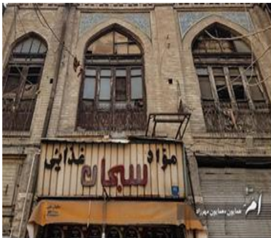
شکل (۳). نمونه‌هایی از اقدامات انسانی آسیب‌رسان در بافت تاریخی محله بهارستان