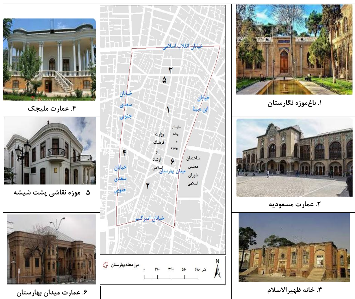
شکل (۲). موقعیت برخی از اماکن مهم و تاریخی محله بهارستان