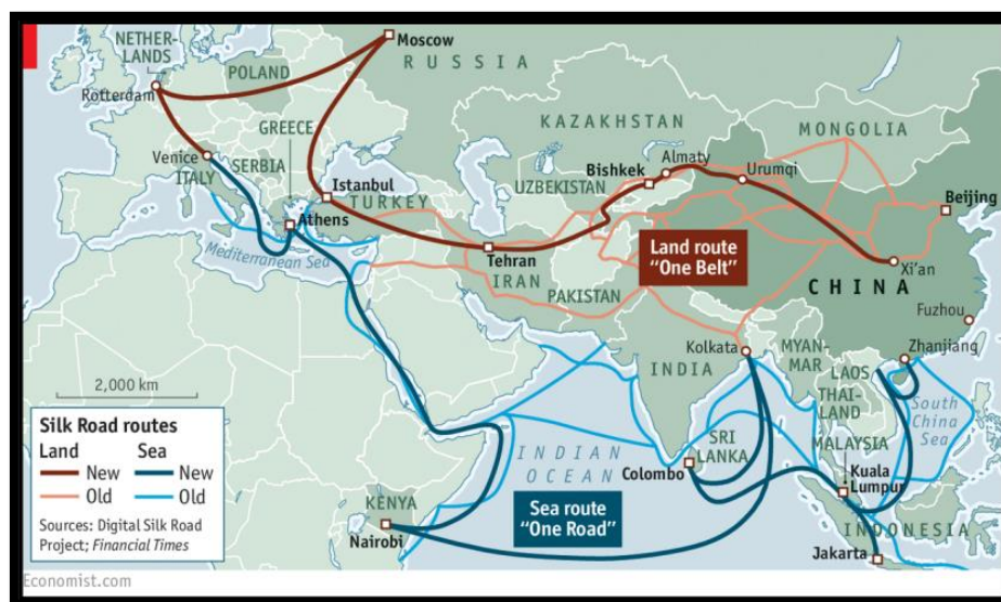
شکل (۳). ایران و کریدورهای بین‌المللی

ایران نگرانی‌های عمده‌ای در مورد جاه‌طلبی‌های ترانزیتی عراق و همکاری این کشور با چین دارد، از تضعیف احتمالی موقعیت خود در تجارت ترانزیتی گرفته تا اینکه بندر خرمشهر در نزدیکی ایران از موقعیت جغرافیایی مشابه فاو برخوردار نیست. همگی این مسائل انزوای بین‌المللی ایران و تأثیر تحریم‌ها بر این کشور را نشان می‌دهد (عزتی، هادی زاده، ۱۳۹۳: ۱-۱۲). پروژه بندر فاو فرصت‌های زیادی را برای عراق فراهم می‌کند تا نقش خود را در ترانزیت منطقه‌ای و موقعیت جغرافیایی خود را به طور گسترده تقویت کند. برای انجام این کار، ابتدا باید به چالش‌های داخلی مانند فساد و اختلافات سیاسی و چالش‌های خارجی مانند رقابت سرمایه‌گذاری بین چین و ایالات متحده بپردازد. با نگاهی به منطقه، به نظر می‌رسد پروژه‌هایی مانند فاو برای برخی از کشورها مانند ایران یک تهدید است، در حالی که احتمالاً به نفع برخی دیگر مانند ترکیه، قطر و سوریه است. علیرغم پتانسیل قابل توجهی که برای عراق وجود دارد، چه از نظر اقتصادی و چه از نظر سیاسی، غلبه بر چالش‌های مرتبط آسان نخواهد بود.