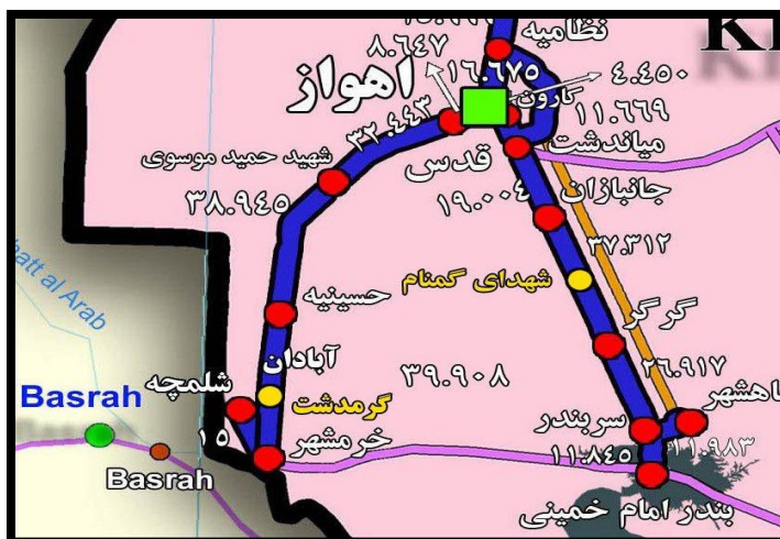
شکل (۵). مسیر ترانزیتی شلمچه_بصره

در عوض شلمچه_بصره، ایران می‌توانست راه آهن کرمانشاه_بغداد را از مسیر قصرشیرین-خانقین راه اندازد چراکه دسترسی به پایتخت در کشوری ازهم‌گسیخته امری است خردمندانه. همچنین، ایران می‌توانست با توسعه خط سنندج_سلیمانیه از مرز باشماق، دسترسی زمینی ایمن به بازار کردستان عراق داشته باشد شکل (۶).