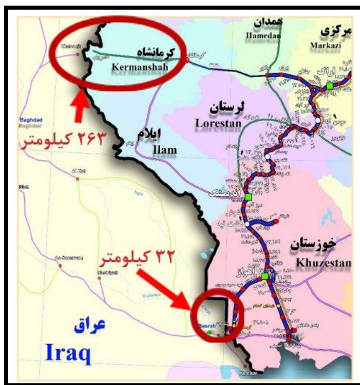
شکل ۶-مسیر ترانزیتی کرمانشاه _ بغداد منبع: رئیسی نژاد، ۱۴۰۰

در عوض شلمچه_بصره، ایران می‌توانست راه آهن کرمانشاه_بغداد را از مسیر قصرشیرین-خانقین راه اندازد چراکه دسترسی به پایتخت در کشوری ازهم‌گسیخته امری است خردمندانه. همچنین، ایران می‌توانست با توسعه خط سنندج_سلیمانیه از مرز باشماق، دسترسی زمینی ایمن به بازار کردستان عراق داشته باشد شکل (۶).