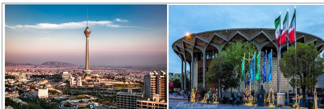
شکل (۳). جاذبه‌های شهر تهران (سمت راست: تصویر تئاتر شهر؛ سمت چپ: تصویر برج میلاد)