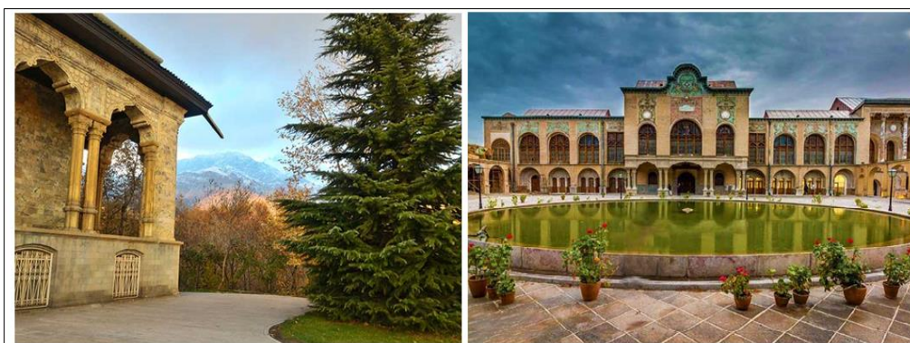
شکل (۲). جاذبه‌های شهر تهران (سمت راست: تصویر باغ موزه نگارستان؛ سمت چپ: تصویر کاخ سعدآباد)