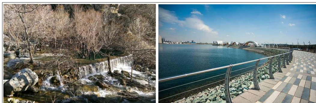
شکل (۴). جاذبه‌های شهر تهران (سمت راست: تصویر دریاچه چیتگر؛ سمت چپ: تصویر درکه)