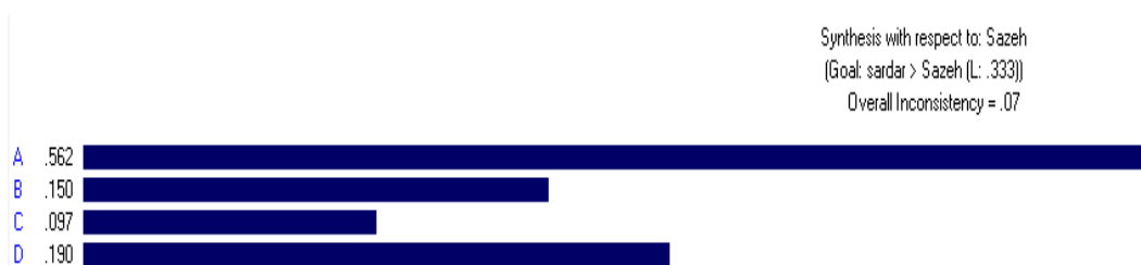
شکل (۳). اولویت‌بندی ویژگی‌های کالبدی سردر بناها (زیرمعیارها) دوره پهلوی در شهر زاهدان

اولویت‌بندی ویژگی‌های تزئینی سردر بناهای دوره پهلوی در شهر زاهدان (زیرمعیارها) اولویت‌بندی ویژگی‌های تزئینی سردر بناهای دوره پهلوی در شهر زاهدان نیز بررسی شد. در این زمینه نیز چهار ویژگی مورد تأکید بوده است که شامل کتیبه آجری ساده، تزئینات (ساده، جناغی، پیچ ماری و رگ چین)، تاجدار ساده با طاق گرد و جناغی و آجرکاری ساده با چین افقی است. تحلیل دیدگاه کارشناسان نشان می‌دهد که ویژگی استفاده از تزئینات ساده، جناغی، پیچ ماری و رگ چین با وزن ۰/۳۷۶ به‌عنوان مهم‌ترین ویژگی یا شاخص تزئینی سردر بناها شناخته شده است. در حقیقت این ویژگی، سردر بناهای دوره پهلوی در شهر زاهدان را متمایز می‌نماید. همچنین استفاده از کتیبه‌های آجری ساده نیز با وزن ۰/۲۴۱ در رتبه دوم اهمیت قرار گرفته است که در بیشتر بناها و سردر بناها قابل‌مشاهده است و نقش مهمی را در تزئینات سردرها ایفا می‌کند. تاجدار بودن ساده با طاق گرد و جناغی با وزن ۰/۲۳۱ در رتبه سوم و آجرکاری ساده با چین افقی نیز با وزن ۰/۱۵۲ در رتبه چهارم این اولویت‌بندی و اهمیت قرار گرفته‌اند؛ بنابراین استفاده از آجر، تاجدار بودن، استفاده از طاق‌های گر و جناغی و همچنین تزئینات غالب با آجر و به‌صورت ساده، غالب ویژگی‌های تزئینی سردر بناهای دوره پهلوی در شهر زاهدان محسوب می‌شود. جدول (۶) و شکل (۴) اولویت‌بندی ویژگی‌های تزئینی سردر بناها (زیرمعیار) دوره پهلوی در شهر زاهدان را با روش AHP نشان می‌دهد.