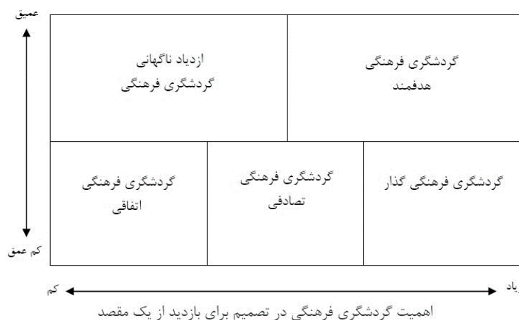
شکل (۳). گردشگری فرهنگی

تولید فرهنگی خواهد شد. شکل (۳). در این مدل، شاخص‌های مورد استفاده، تجربه عمیق و به دنبال آن اهمیت گردشگری فرهنگی در تصمیم برای بازدید از یک مقصد است.