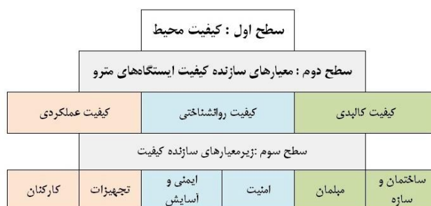
شکل (۲). مدل تجربی کیفیت محیطی ایستگاه‌های مترو

جهت دستیابی به اطلاعات ابتدا اسناد و مدارک، آمار و اطلاعات، متون فارسی، لاتین و ... از طریق مراجعه به کتابخانه، استفاده از نشریات تخصصی، منابع اینترنتی گردآوری شد. مدل تجربی سنجش کیفیت محیط دارای ساختاری سلسله‌مراتبی بوده و متشکل از معیارها و جزمعیارهایی است که در سطوح مختلف آن قرار می‌گیرند. در این جزمعیارهای سطح آخر مدل، مبنای تنظیم پرسشنامه تحقیق قرار گرفته و براساس میزان رضایتمندی یا نارضایتی ساکنین محیط موردنظر امتیازدهی می‌شوند. معیارهای اصلی جهت سنجش در سه دسته شامل معیارهای کالبدی و عملکردی و روان‌شناختی قرار گرفته که سطح دوم از معیارها را تشکیل می‌دهند. معیارها با استفاده از میزان رضایتمندی افراد و با استفاده از مدل‌های تحقیقات مشابه به‌دست آمده‌اند.