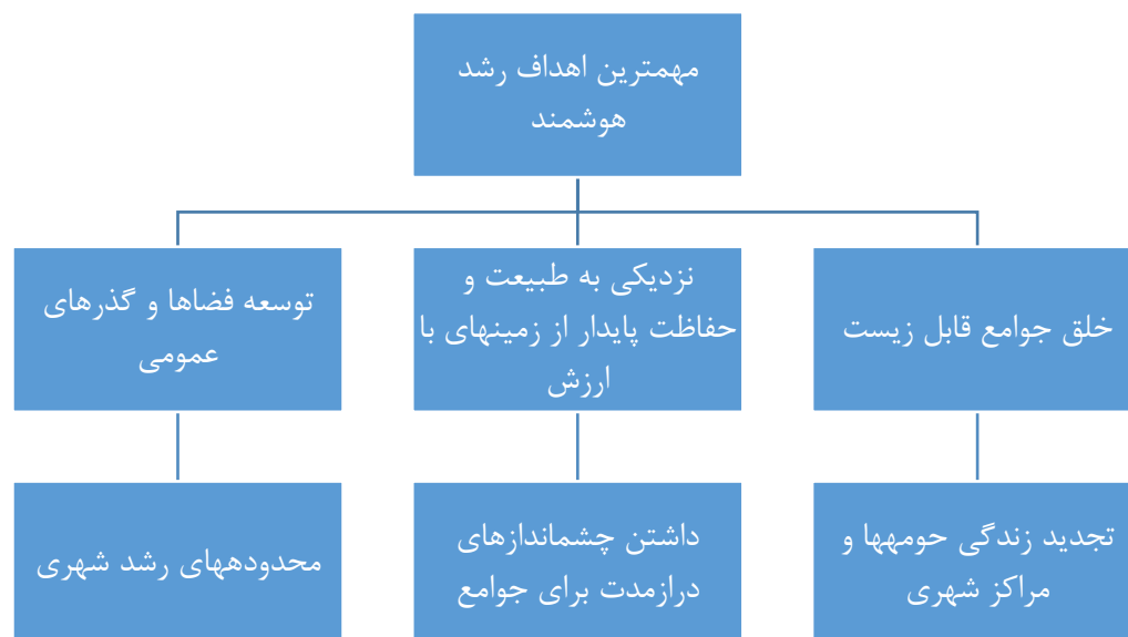
شکل (۱). مهم‌ترین اهداف شهر هوشمند (WWW.jhu.edu)