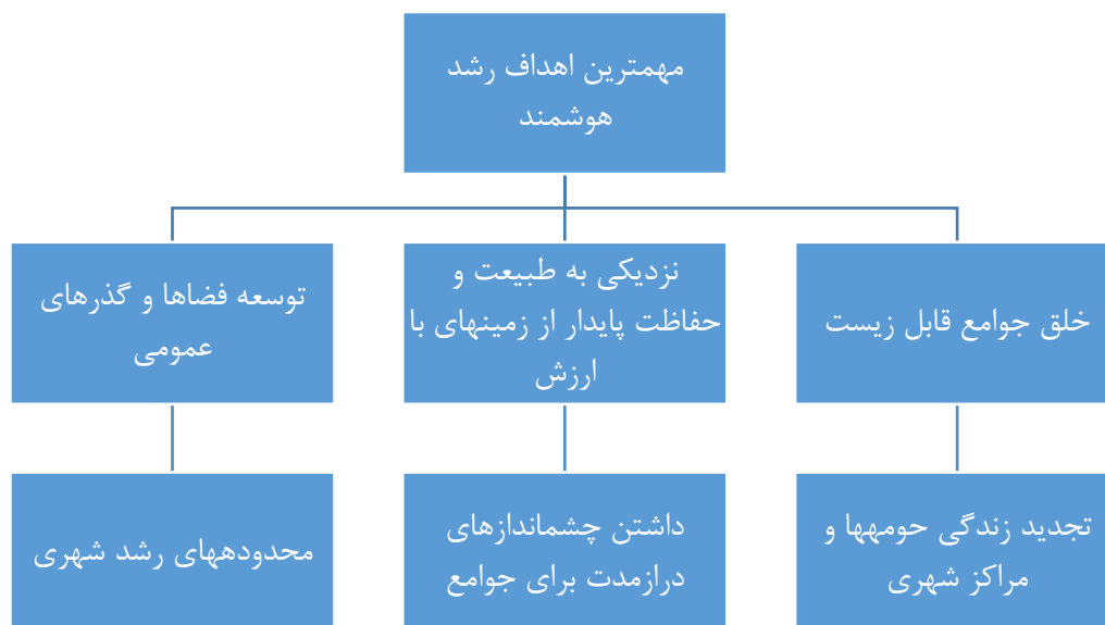
شکل (۱). مهم‌ترین اهداف شهر هوشمند (WWW.jhu.edu)