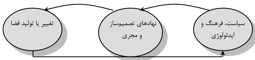
شکل (۱). رابطه سیاست و ایدئولوژی با تغییرات فضایی

در این راستا عناصر و محتوی فضای جغرافیایی در انضمام با نحوه تخصیص منابع و تبیین و چگونگی سیاست‌گذاری آن از سوی قدرت اجتماعی-سیاسی حاکم صورت می‌گیرد. در این راستا جغرافیدانان نسبت‌گرا متأثر از شناخت واقعیت‌های عملکرد سیاست و ایدئولوژی تبیین‌های استقرایی و جزئی را نافع تجویزات و غایت مطالعات اجتماعی ندانسته و در تحلیل فضایی به نقش قدرت در قالب اشکالی همچون گفتمان، ایدئولوژی و اقتصاد سیاسی توجه ویژه‌ای می‌نمایند. در این نگاه پرسش از چیستی گفتمان و سیاست پرسش از مجموعه‌ای از روابط درهم‌تنیده‌ای است که در کار شکل دادن به مناسباتی مرتبط با معنا بخشیدن و شکل دادن به فضای جغرافیایی می‌باشند. در چارچوب امر سیاسی ایدئولوژی، اقتصاد سیاسی و روابط اجتماعی به مدخلی برای شناخت فرم‌ها و فرایندهای فضایی در نظر گرفته می‌شود (تراکمه، ۱۳۹۳: ۲۶)؛ بنابراین هر چند هدف علوم جغرافیایی سازمان‌دهی فضایی در مقیاس‌های مختلف محلی، منطقه‌ای و ملی است. لیکن این سازمان‌دهی بدون لحاظ نمودن اثر هرکدام از سیاست‌های فضایی در ایجاد پراکندگی‌ها و افتراقات مکانی-فضایی ناکامل خواهد بود و فضا محصول نزاع میان «اتوریت‌های رقیب» بر سر دستیابی جهت سازمان‌دهی، اشغال و مدیریت می‌باشد.