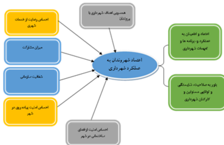
شکل (۱). مدل مفهومی تحقیق مبنی بر عوامل مؤثر بر میزان اعتماد شهروندان به عملکرد شهرداری ساری

این تحقیق، با ترکیب نظریه‌های گیدنز، زتومکا، پاتنام، فوکویاما و پیشینه تجربی تحقیق، عوامل مؤثر بر میزان اعتماد شهروندان به عملکرد شهرداری ساری بر اساس شش مؤلفه همسویی اهداف شهرداری با نیازهای شهروندان، احساس رضایت از خدمات شهری، میزان مشارکت، شفافیت سازمانی، احساس امنیت پیاده‌روی در شهر و احساس امنیت از فضای ساختمانی در شهر بررسی شده است. این شش مؤلفه به صورت مدل تحلیلی در شکل (۱) نشان داده شده‌اند.