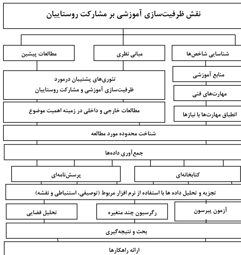
شکل (۳). فرآیند انجام پژوهش؛ ترسیم از نگارندگان

استفاده از نرم افزار SPSS، مورد تجزیه و تحلیل قرار گرفت. در نهایت با استفاده از نرم افزار ARC GIS اقدام به ترسیم نقشه و تحلیل فضایی روستاها از نظر میزان برخورداری از شاخص-های ظرفیت سازی آموزشی نموده است.