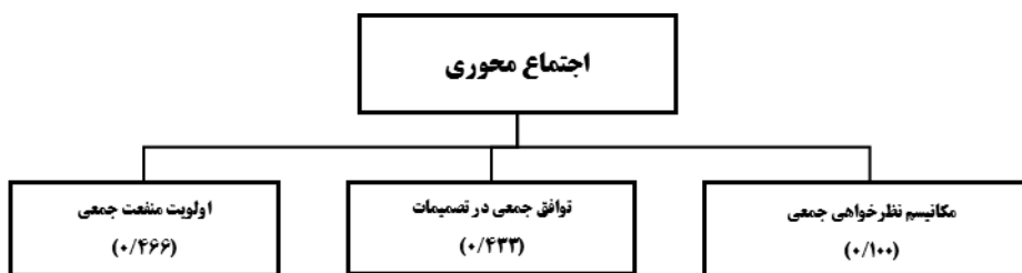
شکل (۱۰). وزن زیرمعیارها برای معیار اجتماع محوری

سپس برای بیان وضعیت محدوده مطالعاتی در ارتباط با هر یک از زیرمعیارهای این بررسی، پرسش‌نامه‌های تدوین شد تا نظر ساکنین کیش در مورد وضعیت هر یک از این زیرمعیارها در محدوده به دست آید. هر یک از سوالات پرسش‌نامه به یکی از زیرمعیارهای این بررسی اشاره داشت. با توجه به فرمول کوکران و حجم جامعه آماری، تعداد ۳۸۰ پرسشنامه به صورت تصادفی بین ساکنین کیش توزیع شد. در این پرسشنامه از طیف