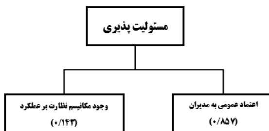
شکل (۶). وزن زیرمعیارها برای معیار مسئولیت پذیری