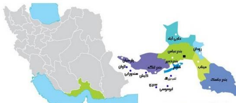
شکل (۱). موقعیت جغرافیایی جزیره کیش