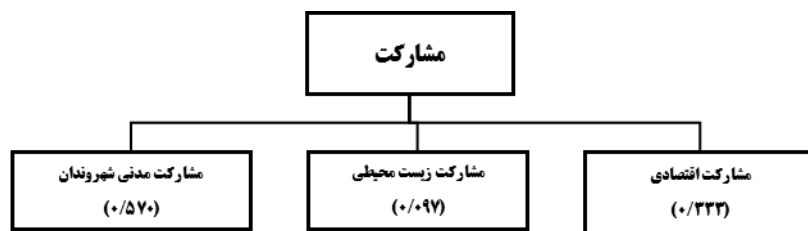
شکل (۳). وزن زیرمعیارها برای معیار مشارکت