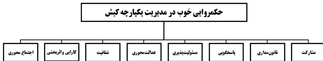
شکل (۲). معیارهای نشانگر حکمروایی خوب در مدیریت یکپارچه کیش

در این بررسی، برای سنجش حکمروایی خوب در مدیریت یکپارچه نواحی ساحلی، هشت معیار مشارکت، قانون‌مداری، پاسخگویی، مسئولیت‌پذیری، عدالت‌محوری، شفافیت، کارایی و اثربخشی و اجتماع‌محوری و بیست و پنج زیرمعیار در محدوده مطالعاتی ارزیابی می‌شود. شکل (۲) معیارهای نشانگر حکمروایی خوب در مدیریت یکپارچه کیش را نشان می‌دهد.