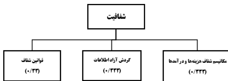
شکل (۸). وزن زیرمعیارها برای معیار شفافیت