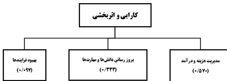
شکل (۹). وزن زیرمعیارها برای معیار کارایی و اثربخشی