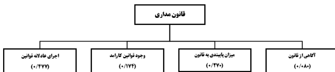
شکل (۴). وزن زیرمعیارها برای معیار قانون مداری