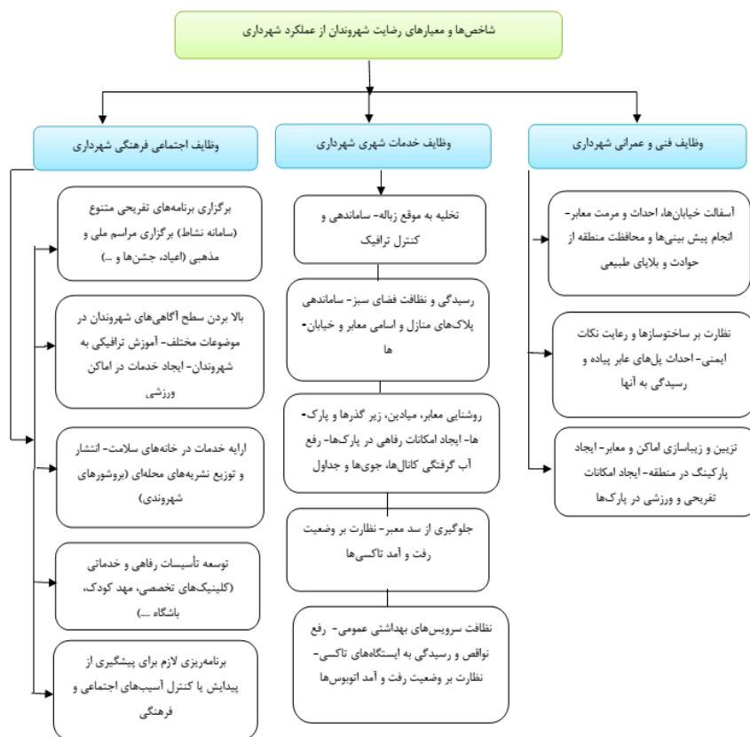
شکل (۳). مدل عملیاتی تحقیق محدودی مورد مطالعه