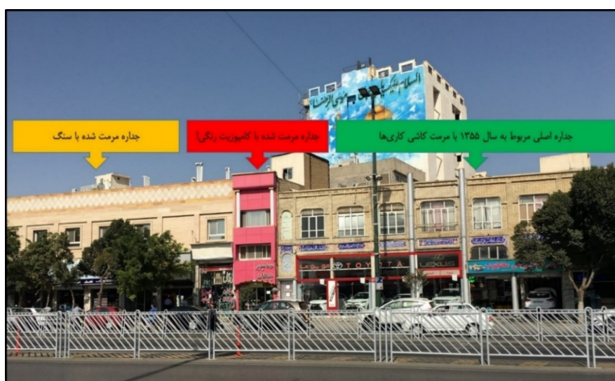
شکل (۷). سه نوع مرمت جداره در خیابان امام رضا (ع)

در شکل (۷) سه نوع مرمت ملاحظه می‌شود. بنای سمت راست، همان جداره اصلی (که مربوط به سال ۱۳۵۵ است) را حفظ نموده و آجرهای آن تمیز و کاشی‌کاری‌های مربوط به نما را احیاء و مرمت کرده است. بنای وسطی با نمای کامپوزیت پوشش داده شده است. بنای سمت چپ با سنگ پوشش داده شده است. بنای وسط و سمت چپ، نمای هویت‌مند، بومی و پایداری که در سال ۱۳۵۵ اجرا شده است را پوشش داده‌اند و همچون وصله‌ای ناهمخوان در جوار نمای اصلی قرار گرفته‌اند.