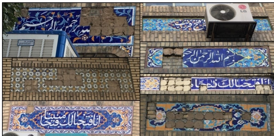
شکل (۶). نمونه‌هایی از بی‌توجهی و مرمت ن نمودن جداره خیابان امام رضا (ع)

است، هم از سوی مالکان و هم از سوی مدیریت شهری. جداره طراحی شده هویت‌مند، بومی و پایدار در سال ۱۳۵۵ اجرا شده است که امروز به واسطه دلایل مختلف رو به فراموشی است.