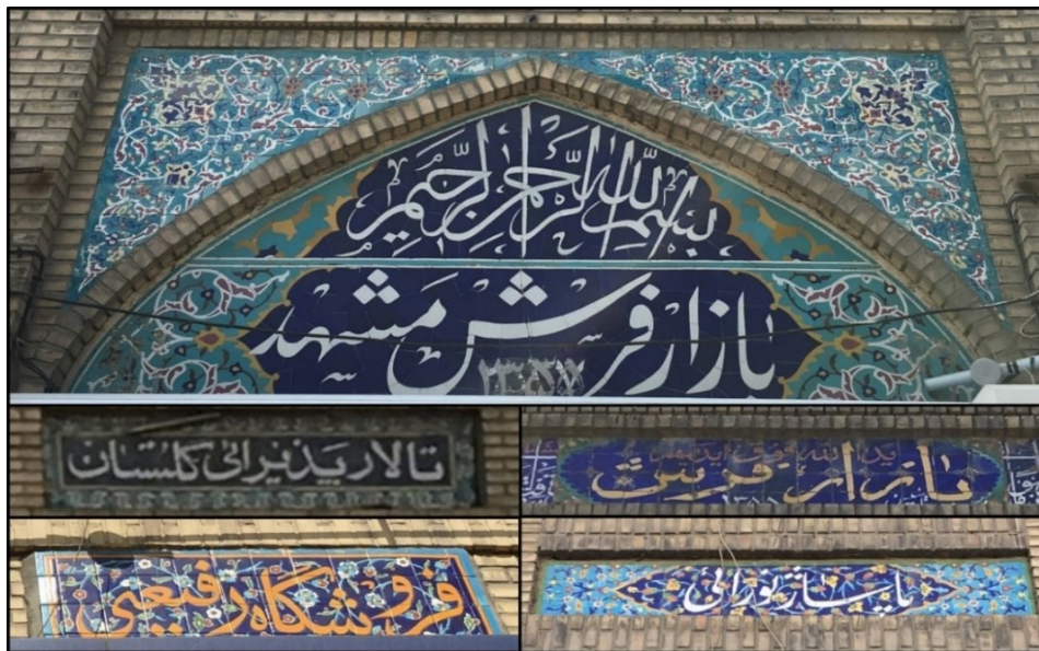
شکل (۵). نمونه‌هایی از تابلوهای استفاده شده در جداره خیابان امام رضا(ع)

جداره‌های خیابان امام رضا(ع) دو دسته نوشته بر روی خود دارند. یکی ذکرهایی است که با کاشی‌کاری بر روی جداره خیابان نقش بسته‌اند و دیگری نام بازارها، پاساژها و واحدهای تجاری است. همه این‌ها با ظاهری هماهنگ و هم‌خوان با یکدیگر شکل گرفته‌اند که هم فرهنگ ایرانی و هم آموزه‌های اسلامی را به نحو مطلوبی به نمایش می‌گذارند. در شکل (۵) نمونه‌ای از کاشی‌کاری‌های از این دست ملاحظه می‌گردد.