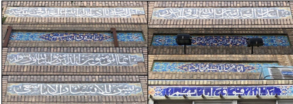
شکل (۴). نمونه‌هایی از اذکار استفاده شده در جداره خیابان امام رضا (ع)

جداره‌های خیابان امام رضا(ع) دو دسته نوشته بر روی خود دارند. یکی ذکرهایی است که با کاشی‌کاری بر روی جداره خیابان نقش بسته‌اند و دیگری نام بازارها، پاساژها و واحدهای تجاری است. همه این‌ها با ظاهری هماهنگ و هم‌خوان با یکدیگر شکل گرفته‌اند که هم فرهنگ ایرانی و هم آموزه‌های اسلامی را به نحو مطلوبی به نمایش می‌گذارند. در شکل (۵) نمونه‌ای از کاشی‌کاری‌های از این دست ملاحظه می‌گردد.