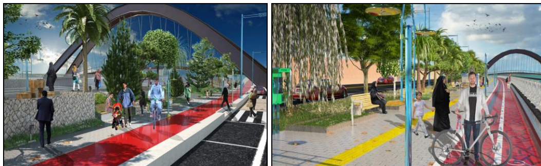
شکل (۸). طراحی سه بعدی فضای پیشنهادی برای ساحل کشکان رود (نگارنده، ۱۳۹۷)

با تاکید ویژه بر محدوده می توان بیان داشت مهم ترین راهبرد برای ایجاد گردشگری شهری رودخانه شهری در این منطقه عبارت است از: تلاش برای ایجاد محیطی اجتماعی و امن با امکانات و سهولت دسترسی و تاکید خاص نسبت به مسائل زیست محیطی و بوم شناختی است. به همین منظور، بر اساس آن چه بیان گشت، معیارهای اصلی طراحی مبتنی بر قابلیت های محلی تعریف می گردد. لازم به ذکر است در زمینه های اجتماعی، تفریحی، تاریخی و زیست محیطی نیز روال بر همین منوال است و این بدان معناست که کلیه راهبردها و معیارهای ساماندهی فضایی و مکانی رودخانه در راستای بومی گرایی و توجه به خواسته های مردم ساکن در محدوده و در یک کلام استفاده کنندگان از طرح به کار گرفته شده است. با توجه به وقوع سیل در فرودین ۹۸ و با توجه به نقشه پهنه های سیلابی در رودخانه کشکان و مطالعات صورت گرفته در باب ساماندهی رودخانه های شهری می توان راهکارهای اجرایی توسعه گردشگری را در قالب اشکال (۸) و (۹) و جدول (۹) پیشنهاد نمود: