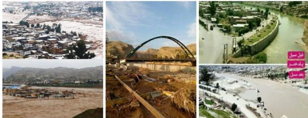
شکل (۳). رودخانه کشکان در پلدختر قبل و بعد از سیل