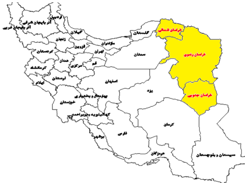
شکل (۱). موقعیت قرارگیری منطقه خراسان (سه استان خراسان شمالی، خراسان رضوی و خراسان جنوبی) در سطح کشور