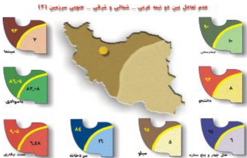
شکل (۲): نابرابری در مناطق مختلف کشور (ماخذ: صرافی، ۱۳۹۴: ۱۲)

سطوح توسعه یافتگی استانهای کشور از ۱۳۴۵ تا ۱۳۹۰