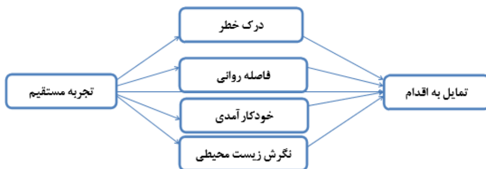
شکل (۱). الگوی علی تعیین روابط بین عوامل مؤثر بر تمایل به اقدام جهت کاهش تغییرات اقلیمی

زمانی در (ذهن) یک فرد در ارتباط است. این تئوری بین فاصله روانی درک شده با تفسیر ذهنی از حوادث رابطه برقرار می‌کند. از آنجا که نیت عمومی برای انجام یک رفتار مثلاً "من قصد دارم اقداماتی برای متوقف کردن گرمایش جهانی انجام دهم" منعکس کننده سطح بالاتری از انتزاع هستند و برای فرد بیشتر جنبه روانی دارند؛ هنگامی که در مورد گرمایش جهانی در سطح انتزاعی فکر می‌شود، افراد بر روی تصویری بزرگتر و ویژگی‌های اصلی این پدیده که یک نمای کلی از وضعیت را ارائه می‌دهد، متمرکز می‌گردند. اما در مقابل نیت در مورد اقدامات خاص مانند (من سعی دارم که کمتر از تهویه کننده‌های هوا در تابستان و گرم کننده‌های هوا در زمستان استفاده کنم) منجر می‌شود مردم بر روی جزئیات گرمایش جهانی تمرکز کنند، به گونه‌ای که تجربیات شخصی برجسته‌تر می‌گردد (برومل و همکاران، ۲۰۱۵؛ ۶۸). از این رو، انتظار می‌رود تجربه شخصی فاصله روانی را و همچنین فاصله روانی تمایل یا نیت افراد را در مورد اقدامات خاص جهت کاهش تغییرات اقلیمی تحت تأثیر قرار دهد. شکل (۱) الگوی علی پیشنهادی جهت تعیین روابط بین عوامل مؤثر بر تمایل به اقدام جهت کاهش تغییرات اقلیمی را نشان می‌دهد.