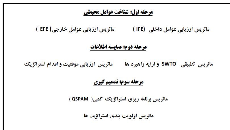
شکل (۱). روش شناسی و چهارچوب تحلیلی برنامه ریزی استراتژیک

این پژوهش با استفاده از روش شناسی توصیفی و تحلیلی و از طریق مطالعات اسنادی و میدانی انجام پذیرفته است. همچنین در پژوهش حاضر روش جمع آوری اطلاعات اسنادی بصورت مراجعه و فیش برداری از مدارک و اسناد کتابخانه‌ای و همچنین در مطالعات میدانی از روش نمونه برداری (روش کوکران)، مشاهده مستقیم، مصاحبه، تهیه عکس، فیلم و برای تجزیه و تحلیل اطلاعات از تکنیک استراتژیک SWOT و نرم افزارهای SPSS و EXCEL استفاده شده است. جامعه آماری مورد مطالعه در این مقاله را خبرگان و مسئولان دستگاهها و نهادهای مرتبط با گردشگری شهری تشکیل می دهند که تعداد ۷۰ نفر بعنوان نمونه انتخاب شده است. سپس باتوجه به تحلیل عوامل چهارگانه قوت، ضعف، تهدیدات و فرصت ها، پرسشنامه ای حاوی ۲۰ پرسش پنج گزینه ای به دست آمد در این بخش برای تکمیل پرسشنامه ها از ۷۰ نفر از خبرگان و مسئولان دستگاهها و نهادهای مرتبط با گردشگری شهر مورد مطالعه کسب نظر انجام شد. پرسش ها بر اساس طیف لیکرت شامل ۵ گزینه خیلی زیاد - زیاد - متوسط - کم و خیلی کم بود. جهت تجزیه و تحلیل اطلاعات و ارائه الگوی راهبردی توسعه توریسم شهری از روش تحلیلی SWOT استفاده شده است که در ابتدا با سنجش محیط داخلی و محیط خارجی شهر فهرستی از نقاط قوت، ضعف، فرصتها و تهدیدات مورد شناسایی قرار گرفت و سپس بوسیله نظر خواهی از خبرگان و مسئولان امر و وزن دهی به هرکدام از این مسائل و سپس محاسبه و تحلیل آنها، اولویت ها مشخص شد و جهت برطرف نمودن یا تقلیل نقاط ضعف و تهدیدها و تقویت و بهبود نقاط قوت و فرصتهای موجود در ارتباط با گسترش گردشگری شهری در شهر شهرکرد، در نهایت استراتژی های مناسبی ارائه شده است. مراحل شناسایی، ارزیابی و وزن دهی به عوامل چهارگانه در تحلیل SWOT عبارتند از شکل (۱):