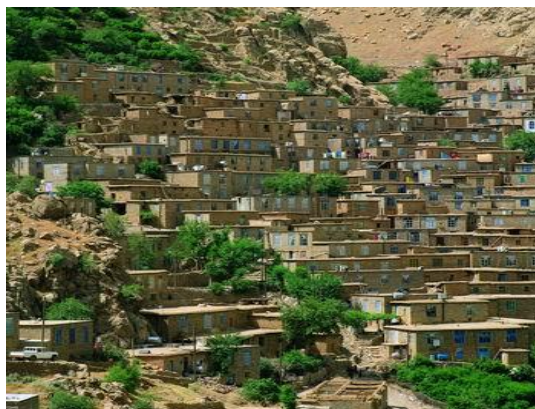
شکل (۲) نمای عمومی روستای هجیج

محدوده مطالعه در این تحقیق، روستای هجیج از توابع بخش نوسود شهرستان پاوه در استان کرمانشاه است که در ۳۴ کیلومتری شهر پاوه و ۱۲۳ کیلومتری کرمانشاه قرار دارد. این روستا دارای ۱۸۰ خانوار، معادل ۶۰۳ نفر جمعیت است (مرکز آمار ایران، ۱۳۹۰) که از شمال غرب و جنوب به کوه‌های سالان و شاهو محدود است که با اقلیمی معتدل و کوهستانی، در بهار و تابستان آب و هوای مطبوعی دارد و در پاییز و زمستان سرد است. اگرچه اسناد معتبری در مورد تاریخ روستای هجیج در دست نیست، اما وجود امامزاده عبدالله معروف به کوسه هجیج بیانگر آن است که این روستا سابقه تاریخی دیرینه‌ای دارد و قدمت آن به بیش از ۵۰۰ سال می‌رسد. جاذبه‌های گردشگری این روستا ترکیبی از میراث طبیعی و فرهنگی از جمله شامل چشم‌اندازهای کوهستانی و سبز پیرامون روستا، رودخانه دایمی، بافت کالبدی روستا با معماری پله‌کانی، مصالح ساختمانی بوم‌آورد، ویژگی‌های مردم‌شناختی مانند آیین‌ها و آداب کردی، پوشش سنتی مردان و زنان، صنایع دستی خاص نظیر گیوه‌بافی و ... است (شکل ۲).