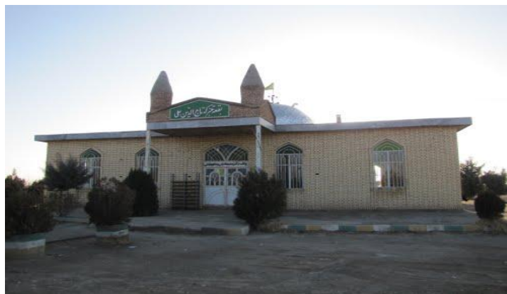
شکل (۲) زیارتگاه تاج الدین علی واقع در روستای قیچاق در دهستان مرحمت آباد شمالی

بازسازی آن با مساعدت شجاع الدوله حاکم مراغه در اواخر قاجار که به دست مردم منطقه بصورت بقعه‌ای چهارگوش با گنبد دوار از آجرپخته ساخته شده است (شکل ۲). زیارتگاه تاج الدین علی، مبین قدمت هزاران ساله است. بررسی‌ها نشان می‌دهد بطور متوسط ماهانه حدود ۲۴۰۰ نفر گردشگر از شهرها و روستاهای دور و نزدیک به این مکان مقدس مراجعه می‌کنند (اداره اوقاف شهرستان میاندوآب، ۱۳۹۲).