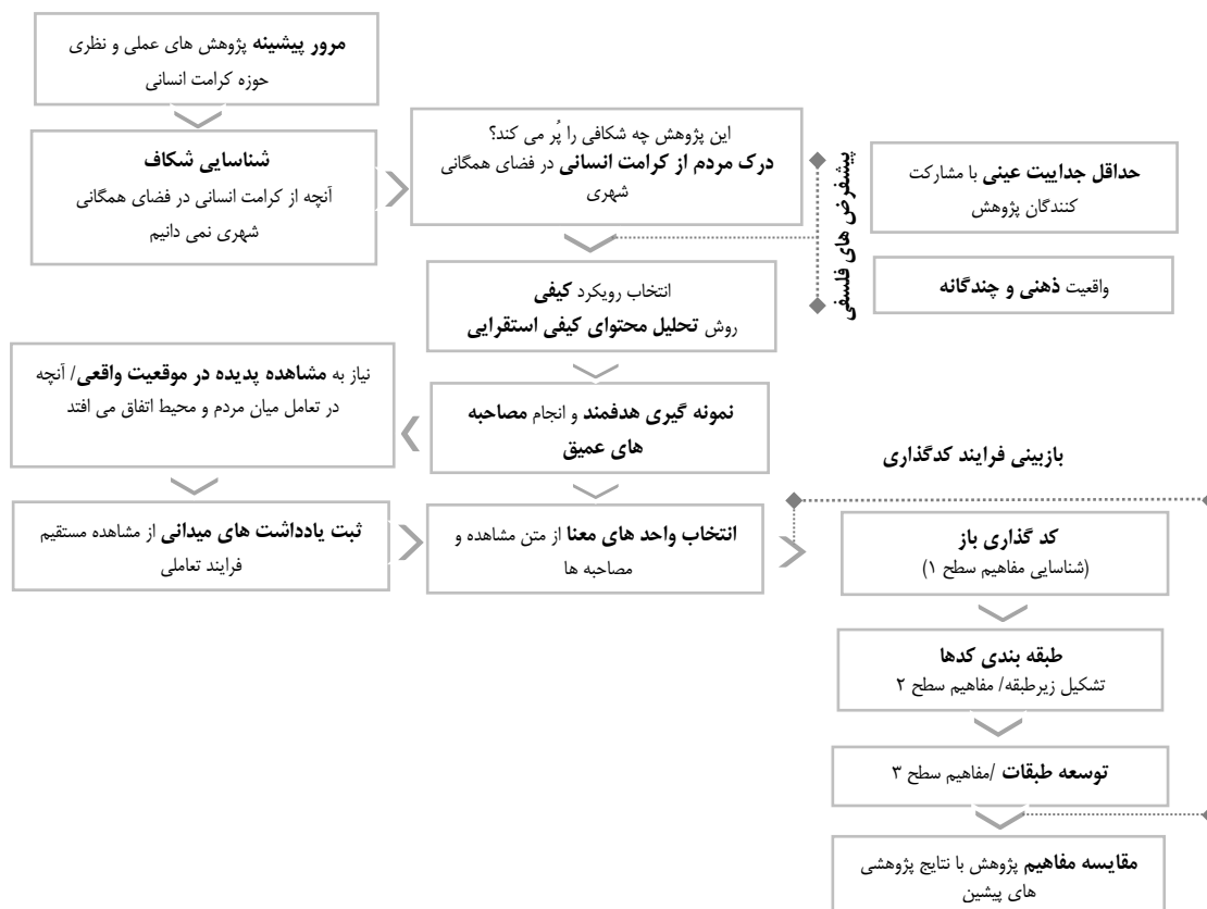
شکل (۱). فرآیند پژوهش

از میان مطالعات انجام شده در این حوزه می‌توان به مطالعه‌ی کااو و ۲۰۱۹، اشاره کرد که به روابط اجتماعی و الگوهای استفاده از فضاهای همگانی شهری در انگلستان و چین اشاره کرد که به تجزیه و تحلیل الگوهای استفاده از فضای همگانی و انواع روابط اجتماعی می‌پردازد. داده‌های مشاهده شده‌ی این مطالعه از چهار فضای عمومی واقع در شزو چین و شفیلد انگلستان استخراج شده و ویژگی‌های شخصی کاربران، فعالیت‌های آن‌ها و نحوه اشغال فضای همگانی را مورد تحلیل قرار داده است. نتایج این مطالعه به اهمیت فضاهای همگانی برای انواع کاربران و نحوه‌ی استفاده از آن فضا و گروه‌های مختلف اجتماعی می‌پردازد. مطالعه دراوکوف ۲۰۱۹، به بازنگری مفهوم کرامت انسانی در عصر جدید می‌پردازد. در این مطالعه عزت نفس را یکی از مفاهیمی می‌داند که در چند دهه گذشته به طور چشمگیری تغییر کرده است. این مطالعه تلاش می‌کند که این مفهوم را از مخاطرات فناوری‌های جدید و امکان تهدید شأن انسانی مورد توجه قرار دهد.