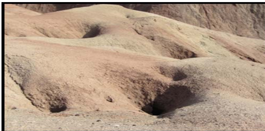
شکل (۷) پدیده پای پینگ در سطح گنبد‌های نمکی