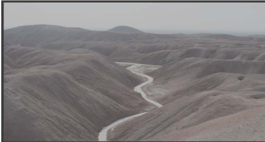
شکل (۶) رودخانه‌ی فصلی شور در دامنه‌های پشت به جاده