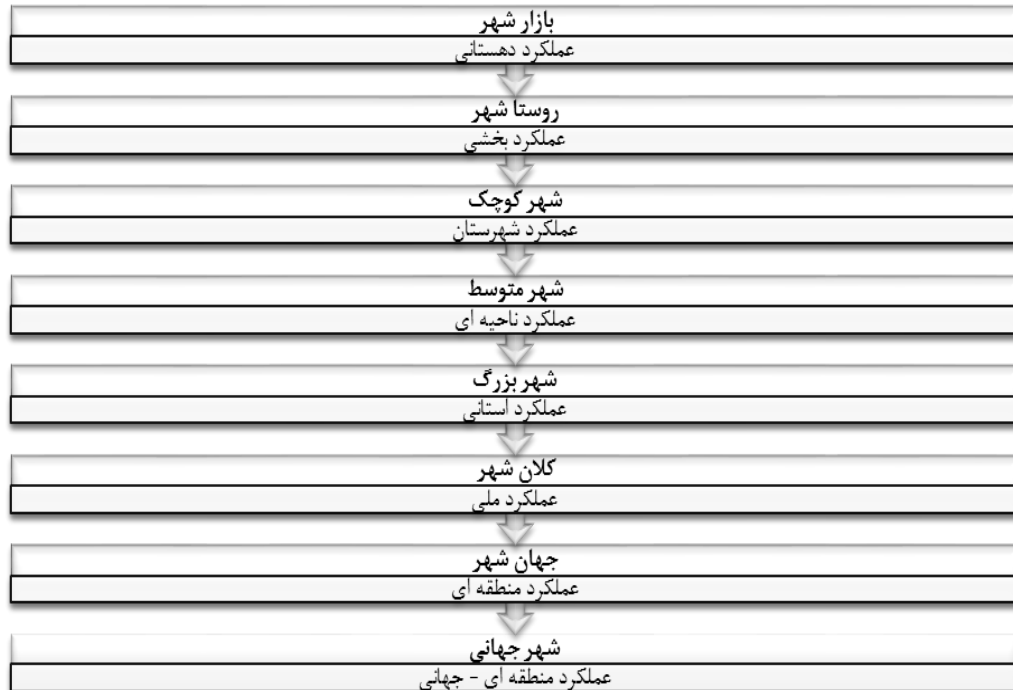
شکل (۲). انواع شهر از نظر اندازه و عملکرد فضایی

جغرافیدانان، شهر را محل تمرکز جمعیت، ابزار تولید، سرمایه، نیازها و احتیاجات و غیره می دانند که تقسیم کار اجتماعی نیز در آنجا صورت گرفته است و شهر را منظره‌ای مصنوعی از خیابانها، ساختمانها، دستگاهها و بناهایی می دانند که زندگی را امکان پذیر می سازد. بنابراین، شهر ترکیبی از عناصر مادی (مدنیت) و غیر مادی (اخلاقی) است که بخش دوم مهمتر است. (ربانی، ۱۳۸۷: ۱-۳).