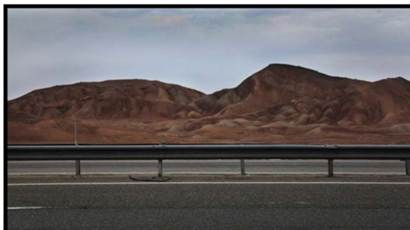
شکل (۵) گنبد نمکی نامنظم در مجاورت آزادراه قم- کاشان

جاذبه ها و قابلیت های گردشگری: آشنایی عموم گردشگران با پدیده های ژئومورفولوژیک و لندفرم های حاصل از تکتونیک نمکی نظیر پدیده ی پای پینگ و غیره؛ جاذبه های آموزشی (تخصصی) در زمینه ی شناخت تکتونیک، ماگماتیسم، ژئومورفولوژی ساختمانی و غیره.