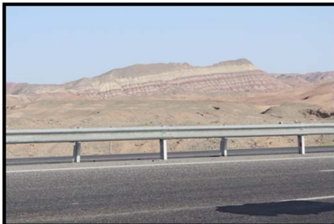
شکل (۲) اشکال چین خورده ترشیاری در تشکیلات تبخیری