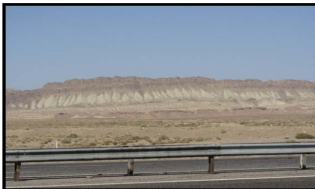
شکل (۳) بدلند و شیب های واریزه ای پیوسته در مجاورت آزاد راه قم - کاشان

جاذبه ها و قابلیت های گردشگری: جاذبه های آموزشی از منطقه علاوه بر مشاهده ی زیبایی چشم اندازها، در زمینه ی شناخت فرایندهای دامنه ای از نمونه توان های ژئومورفوتوریستی این سایت می باشد.