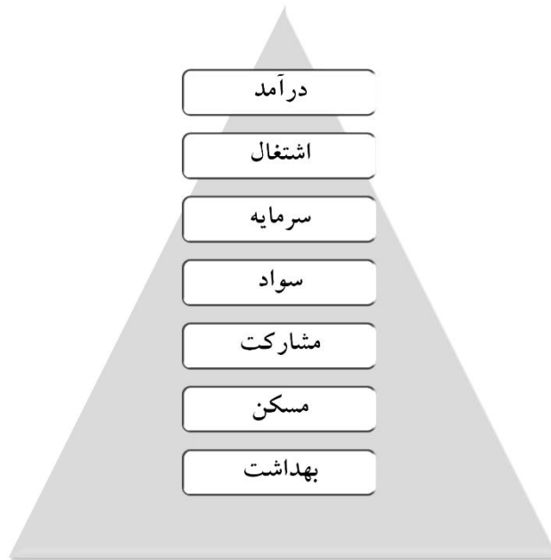
شکل (۳) هرم نیازهای اساسی توسعه روستایی در دهستان شوسف شهرستان نهبندان