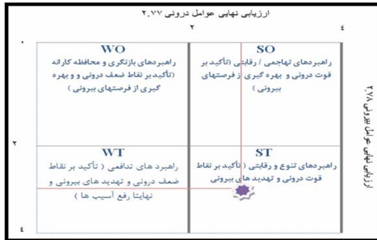
شکل (۲) ماتریس نمره نهایی ارزیابی عوامل داخلی و خارجی (مأخذ: نگارندگان ۱۳۹۰)