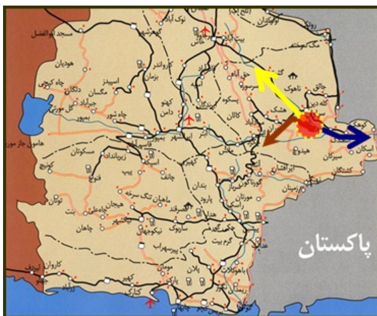
شکل (۲) نمایی از محورهای اصلی منطقه نمونه گردشگری کلپورگان با نواحی پیرامونی