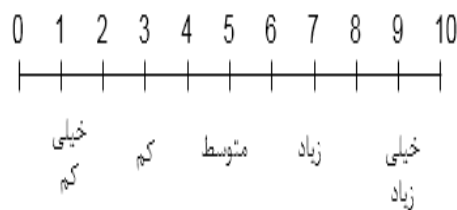
شکل (۴). مقیاس دوقطبی فاصله‌ای

پس از روشن شدن میزان اهمیت معیارها و شاخص‌ها، می‌باید امتیاز آن‌ها مشخص شود. برای تعیین امتیاز، از اطلاعات مربوط به جداول مقایسه وضع موجود منطقه (حین اجرا طرح) و طرح موردنظر استفاده شد. این اطلاعات حاصل تجزیه و تحلیل وضع موجود در منطقه و طرح CDS است که پیش‌از این بدان اشاره شد. به این صورت که پس از دریافت نظرات در قالب مصاحبه آزاد، امتیازدهی به معیارها انجام شد. برای اندازه‌گیری امتیاز اثرات مثبت و عوامل منفی بر هر شاخص و در نهایت معیار، از مقیاس دوقطبی فاصله‌ای استفاده شد. این اندازه‌گیری بر اساس یک مقیاس ۱۰ نقطه‌ای است که در آن صفر مشخص‌کننده حداقل ارزش ممکن و ۱۰ مشخص‌کننده حداکثر ارزش ممکن از اثرات عوامل مثبت بر معیارهای موردنظر است. در این مقیاس، نقطه وسط (۵) نقطه شکست مقیاس بین مطلوب و نامطلوب است، ضمناً از مقادیر ۲، ۴، ۶، و ۸ می‌توان در هنگامی استفاده کرد که حالت‌های میانه وجود دارد (زبردست و همکاران، ۱۳۹۲).