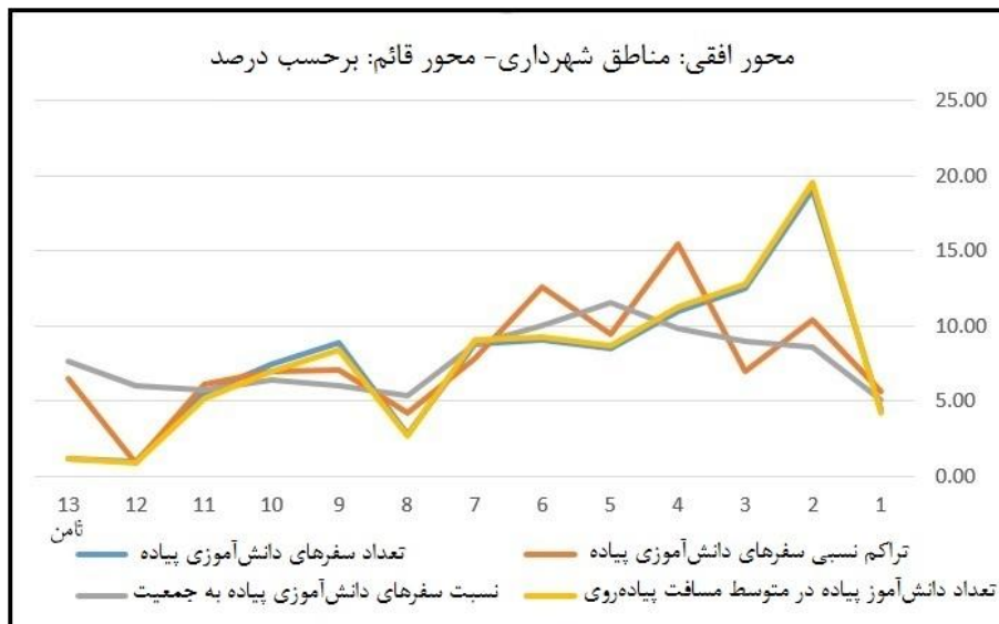
شکل (۳) نمودار تغییرات شاخص‌های محاسبه شده در مناطق شهرداری مشهد